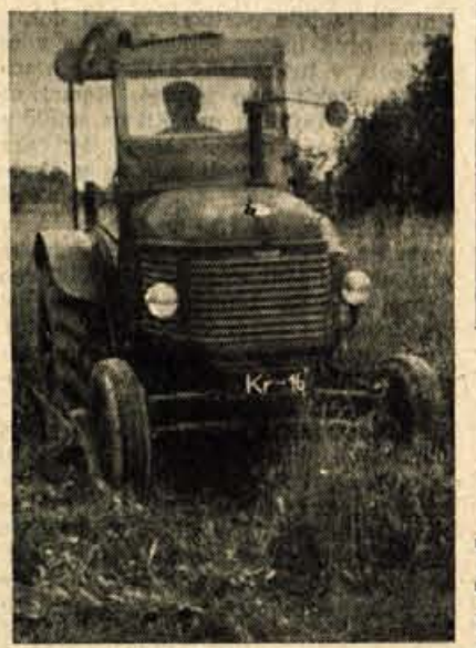
TRAKTOR — »Atomka bomba« v kmetijstvu

pospeševanjem kmetijstva na Gorenjskem. Drugo vprašanje pa so področne