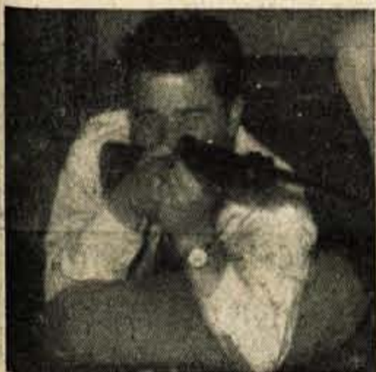
IZTOK — za prvič odlično

Med tednom so imeli novinarji »Glasna Gorenjska« v gosteh strelce iz Predoslj in imeli z njimi prijateljski strelski dvoboj. Za vsako ekipo so tekmovali štirje strelci. Medtem ko je SD