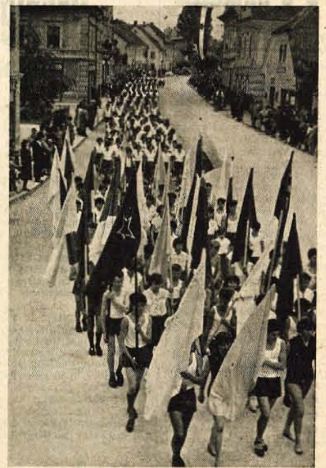
MANIFESTACIJA TELESNE VZGOJE Z večerajšnje parade članov TVD »Partizane« v Kranju