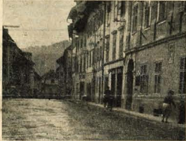
Mestni trg v Loki je vsak ponedeljek prazen