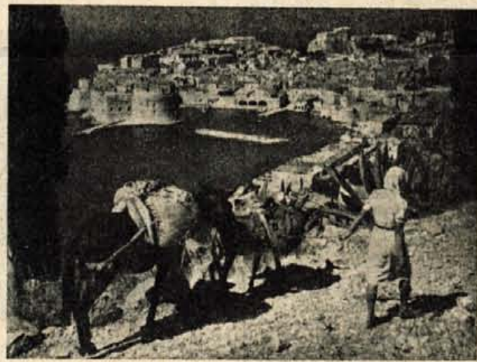
DUBROVNIK — najlepše mesto našega Jadrana

Splitu. Avtobus vozi vsake pol ure, parnik pa 4 do 5-krat dnevno. Razen tega ima ta kraj