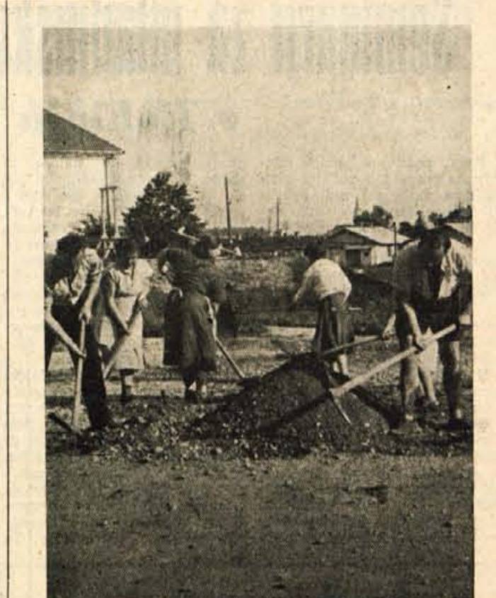
Na Zlatem polju lahko vsak dan vidimo prebivalce, kako s prostovoljnimi deli urejajo okolje stanovanjskih blokov

no skupino, ki pa je zaradi pomanjkanja prostora postala nedelavna. Folklorna skupina je hodila vadit v gostilno »Kanonir«, kar prav gotovo ni bilo primerno, saj so morali po 1 uro daleč peš na vaje. Razen tega pa v gostilni »Kanonir« mladinci in mladinke niso dobili preveč lepih vzgledov in so zato te prostore opustili. Sklepnili so, da bodo v bodoče uredili primernejši prostor v domu »Korotan« na Jezerskem, kjer je sedaj tudi že knjižnica. S predlogom so se vsi strinjali, pomislek je bil edino ta, da ne bi okrnili turizma z odvzemom 2 sob. Pričakovati je, da bo mladina do jeseni tudi na Jezerskem dobila sebi primeren kotiček, kjer se bo lahko nemoteno sestajala in učila.