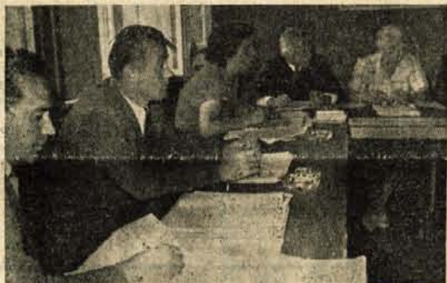
POMEMBNO ZASEDANJE Občinski odborniki z Bleda med sprejemanjem družbenega plana in proračuna za 1956. leto.

Proračun blejske občine znaša v celoti 59 milijonov dinarjev. V to vsoto so zajeti vsi izdatki za državno upravo ter dotacije kulturnim in športnim društvom ter družbenim organizacijam.