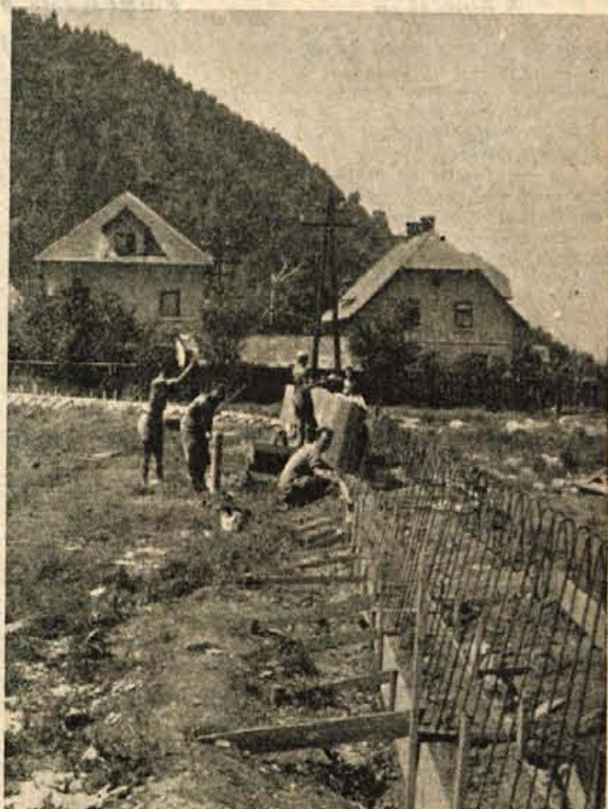
LJUDSKA TEHNIKA GRADI NA STADIONU »MLADOST« V STRAZIŠČU MODERNO DIRKALIŠČNO STEZO. TO BO PRVA TAKA STEZA NA GORENJSKEM. DOGRAJENA BO V JULIJU, KER TAKRAT ŽE PREDVIDEVAJO PRVE MEDNARODNE AVTO-MOTO DIRKE. VSEKAKOR JE TO POMEMBNA PRIDOBITEV ZA KRANJ IN LEPA POČASTITEV 10. OBLETNICE LJUDSKE TEHNIKE.

Izdaja: Gorenjski tisk / Ureja: Uredniški odbor / Odgovorni urednik: Slavko Beznik Telef. uredništva 475 — uprave 190 / Tekoči račun pri Komunalni banki Kranj šte. 61-KB-1-Z-135 / Izhaja v ponedeljek in petek / Naročnina: letna 900, polletna 300, mesečna 50 dinarjev.