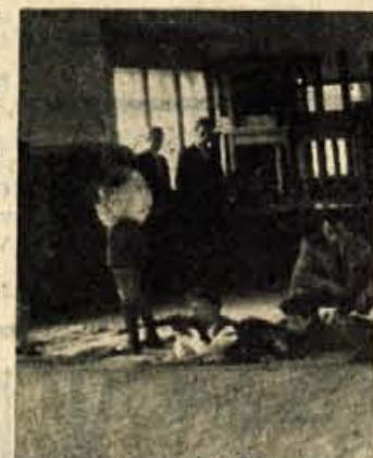
NARASČAJ V Stražišču so se pomerili pionirji - strelci

mi, ki so jih dobili na strelišču podobno kot kupiš mačka v zaklju. Zanimivo je bilo gledati