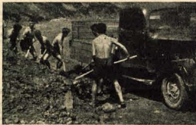
Z UDARNIŠKIM DELOM si bodo tržiški športniki sami uredili lep športni stadion.

NOGOMET JE ZE vrsto let zelo privlačen šport v Tržiču. Toda skoraj večno drugi v Gorenjski nogometni podzvezi (le enkrat so tekmovali v drugi slovenski ligi), niso imeli nikdar pravice, da bi smeli prestopiti prag v višji razred — v prvo slovensko nogometno ligo. Letos pa jim je končno uspelo osvojiti naslov gorenjskega prvaka! Ta svoj uspeh so dosegli povsem zasluženo, kar dokazuje tudi količnik med doseženimi in prejetimi goli — 66:8. S tem pa si seveda še niso priborili pravice tekmovali v višji skupini. Za to bodo potrebne še nove borbe — nove zmage. Precej težko preizkušnja bodo morali prestati v kvalifikacijskih srečanjih, na katere pa sami nogometaši in