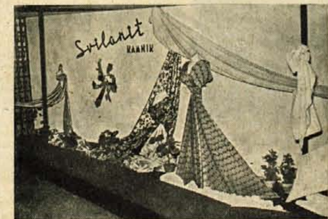
Razstavnii paviljon tovarne »Svilanit« iz Kamnika na lanskoletnem Gorenjskem sejmii

skoletno število razstavljalcev letos ne le doseženo, temveč celo preseženo.