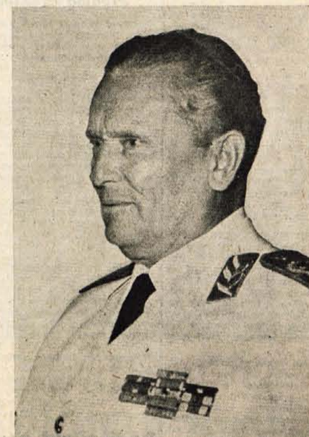
Tovariš Tito - iskreno čestitamo!