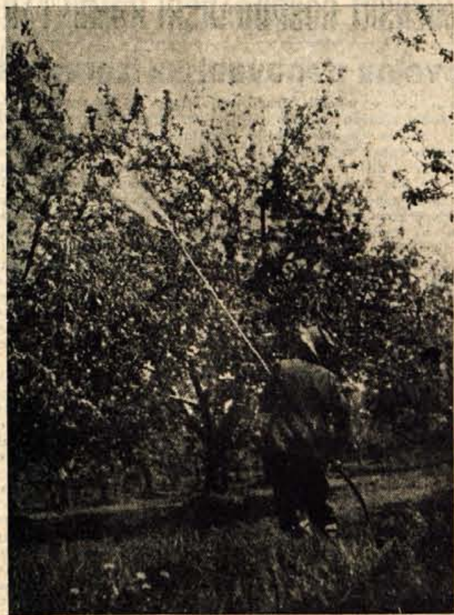
S spomladanskim škropljenjem sadnega drevja preprečujemo škrlup ter gnilobo (moniliozo) plodov