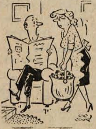
»Nikar se tako ne muči, preljuba. Rajši naloži samo pol, pa pojdi dvakrat.«