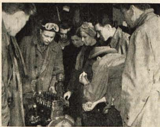
Tečajniki v mehanični delavnici