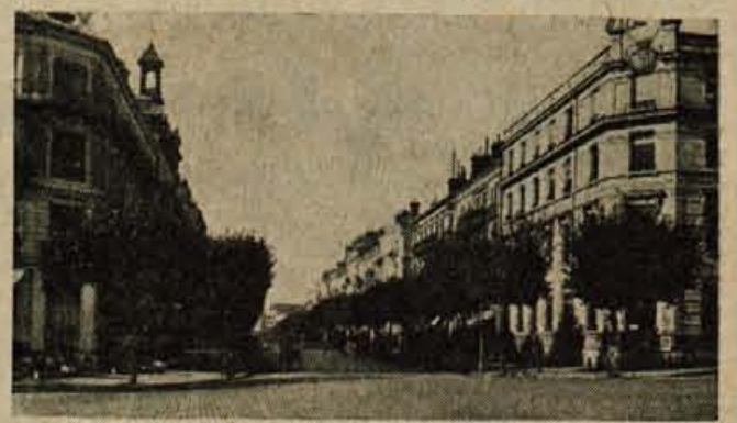
CHALON sur SAONE. Vogalna stavba na levi je »Soldatenheim«, ki so ga poleti 1943 minirali