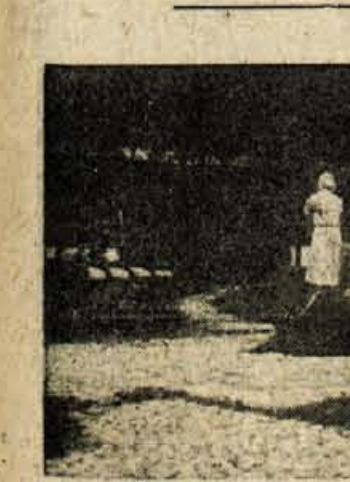
GROBIŠČE TALCEV V BEGUNJAH

Kot smo že poročali, so prejšnjo nedeljo Begunje že četrtič praznovali svoj krajevni praznik. Ta dan je na stotine vojevcev padlih žrtev fašističnega terorja obiskalo grobove na krajskem vrtu za bivšo kaznilnico in jih obsulo s cvetjem.