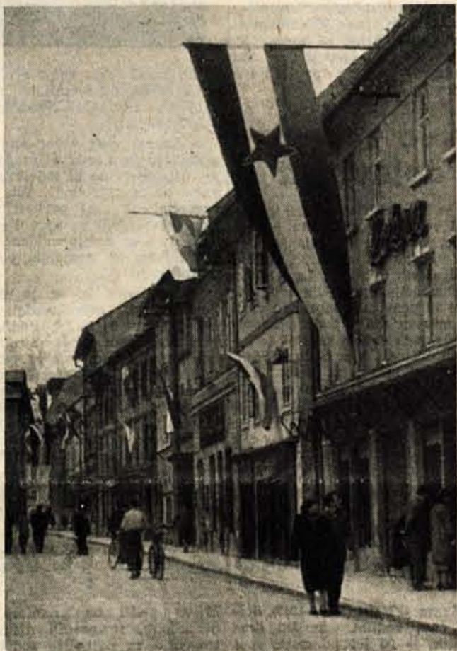
Oo največjem delavskem prazniku so bila vsa mesta in vasi v prazničnem razpoloženju

je zbrani množici govoril o pomenu prvomajskega praznovanja, o revolucionarnem in zmagoitem boju naših delavcev za pravice, ki so jih v polni meri deležni šele v socialistični Jugoslaviji. Nato so na trgu zavrteli jugoslovanski film »Peseem s Kumbare« in šele pozno v noč so se zbrani mladinci, mladinke, delavci in delavke v veselem razpoloženju razšli.