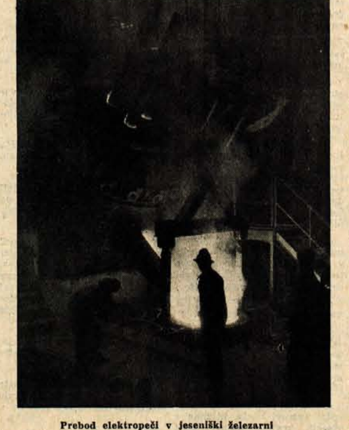
Prebod elektropeči v jeseniški železarni

Danes je Železarna Jesenice močan gospodarski, s tem pa tudi politični činitelj naše socialistične skupnosti. Skoro polovico potreb po železu in jeklu v naši državi krije proizvodnja Železarne Jesenice. Dandanes proizvodi Železarna Jesenice z uspehom konkurirajo na številnih inozemskih tržiščih. Pridne roke jeseniškega delavstva pa so porok za nove uspehe, ki bodo v čast in korist vsej naši skupnosti.