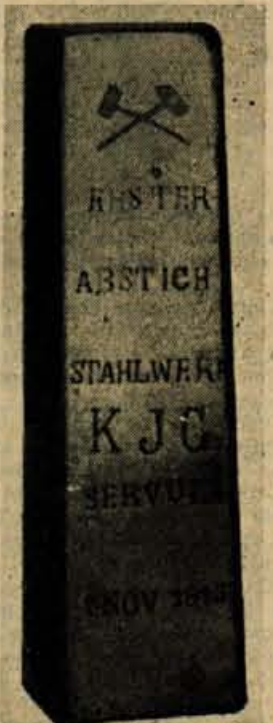
Miniaturni spominski ingot — Škednj, 5. nov. 1912

dorom skozi Karavanke, je bila za obstoj industrije na Jesenicah zelo važna. Hkrati pa so