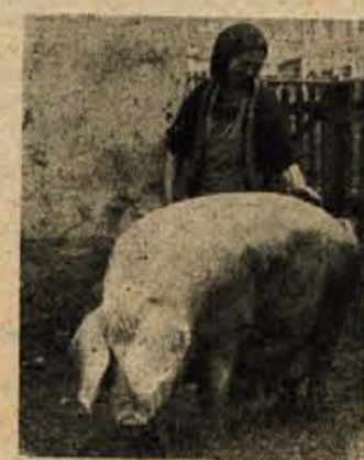
Ema in »Mlaka« sta dobri prijateljici

Kdor bi mislil, da bo ob sicer zelo lepem posloplju Kmetijske šole zagledal razsčno