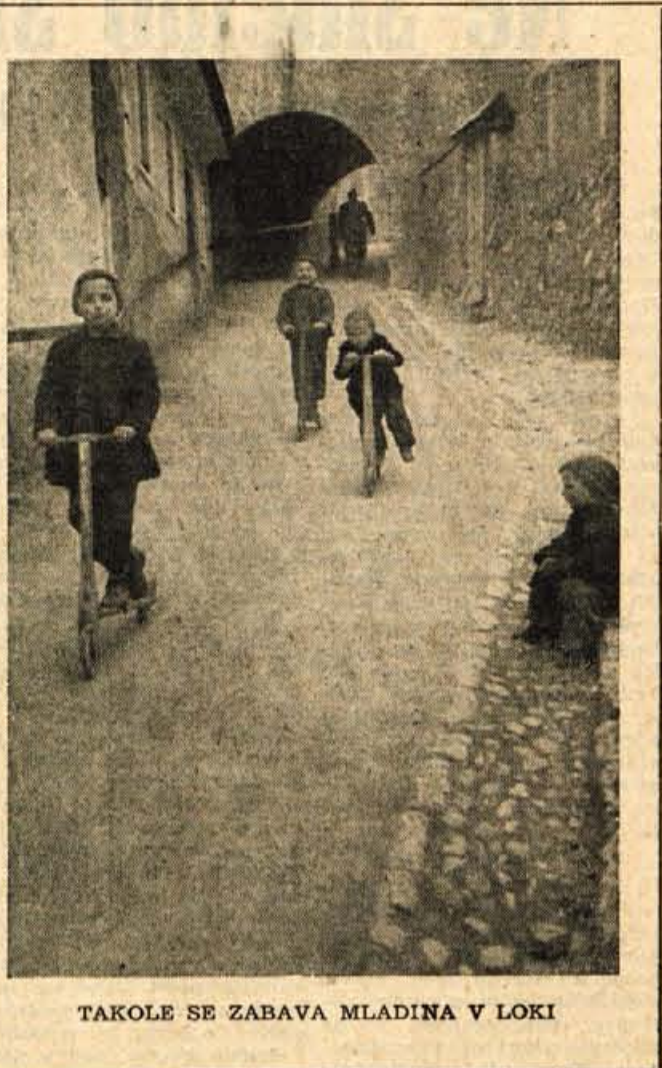
TAKOLE SE ZABAVA MLADINA V LOKI

Predpisi morajo biti pomoč našemu gospodarskemu aparatu (Nadaljevanje na 4. strani)