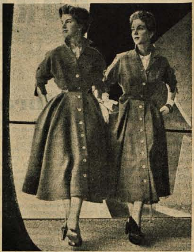
Dva ljubka modela oblek v obliki plašča. Te vrste oblek nosimo lahko same, ali pa pod nje oblečemo svetle bluze ali puloverje.