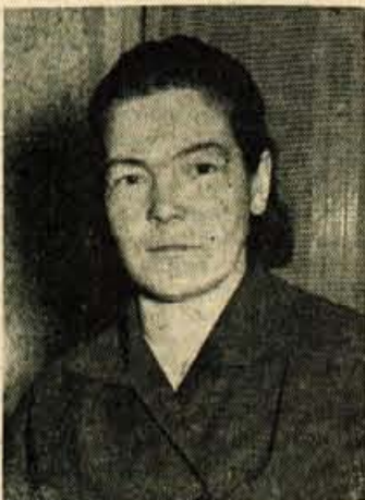
oiočila za neizprosni boj z okupatorjem.

Kam vas je potem vodila pot? — Prijela sem za puško in se