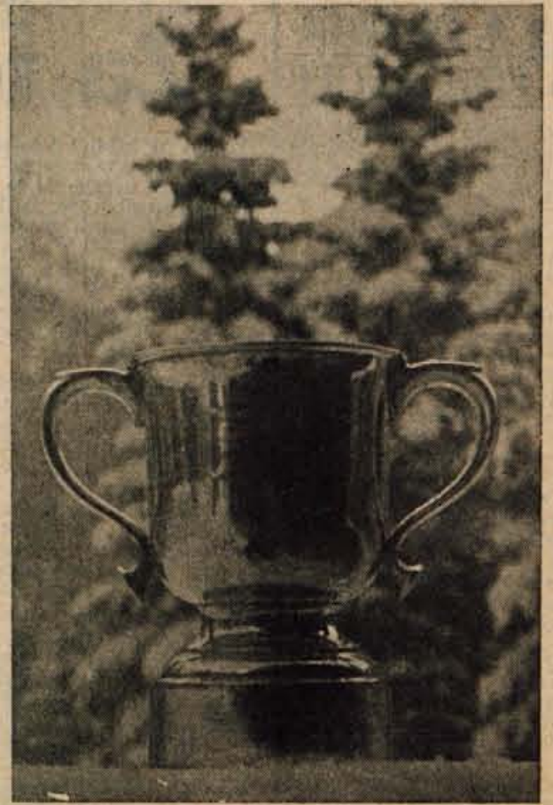
CUP KURIKKALA Zanj so se borili tri dni v Planici