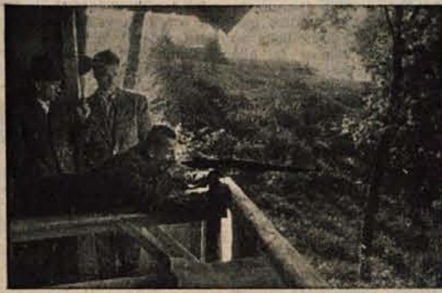
Strelci z Visokega so si razen strelšča v preteklem letu zgradili tudi barako

Preteklo nedeljo so imeli je strelšče, niso zanemarjali ostalega dela družine. Imeli so več prireditve doma, prav tako pa so se udeleževali tudi prired-