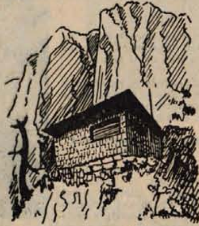
BIVAK V STORŽIČU