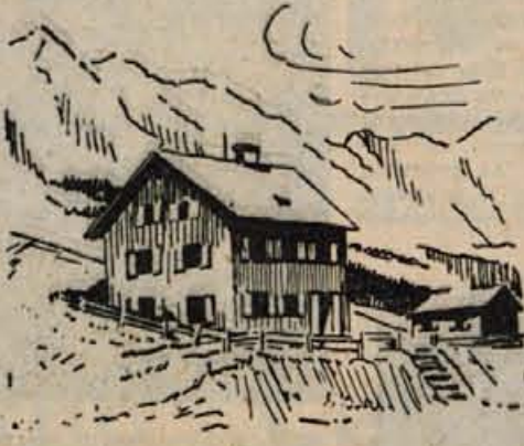
DOM NA KOFCAH