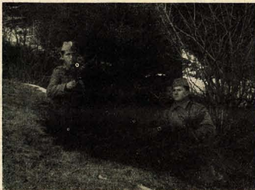
VEDNO V PRIPRAVLJENOSTI