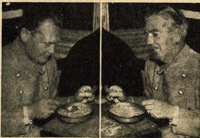
Predsed. angleške vlade Sir Anthony Eden je z napadom na Egipt skuhal zares vročo juho. Ali jo bo moral tudi pojediti? Naša zgornja slika kaže

Čete napadalcev se umikajo iz Egipta. Kaj bodo Združeni narodi storili zdaj? Bodo napadalce kaznovali? Celó v samem angleškem parlamentu so se čuli glasovi, ki to