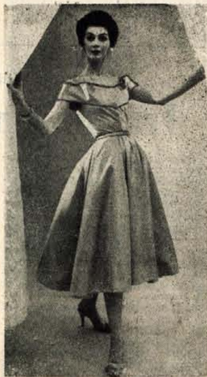
ZA NOVOLETNI PLES

»Naštetj ves denar, ki ga poznaš!« Pri tem vprašanju zberemo na mizo kovance po 50 para, 1 dinar, 2 dinarja, 5 dinarjev in papirnati denar do 100 dinarjev. Otroku naj ga zloži po vrednosti. Po končanem osmem letu mora to nalogo rešiti brez napake.