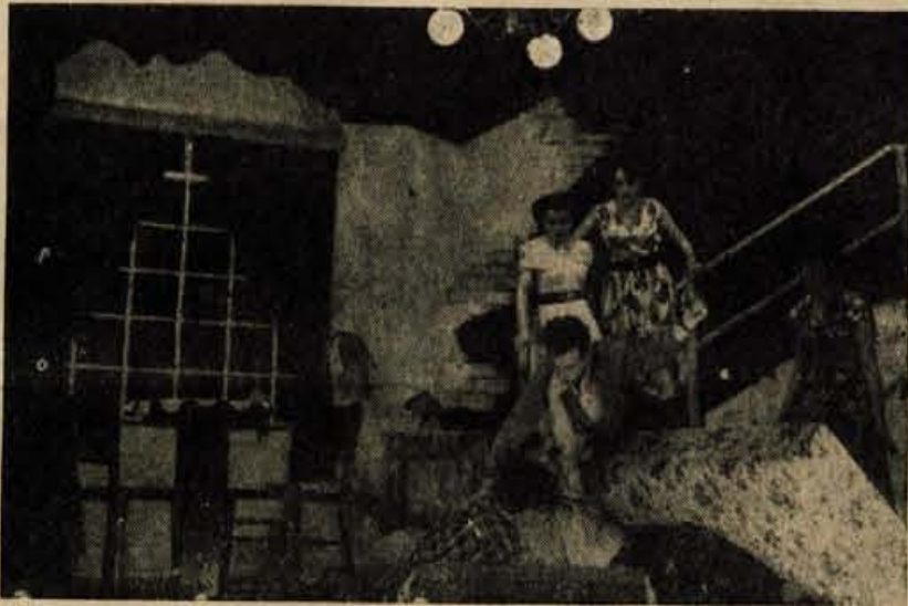
»SREČNI DNEVI« DPD SVOBODE V BOHINJSKI BISTRICI