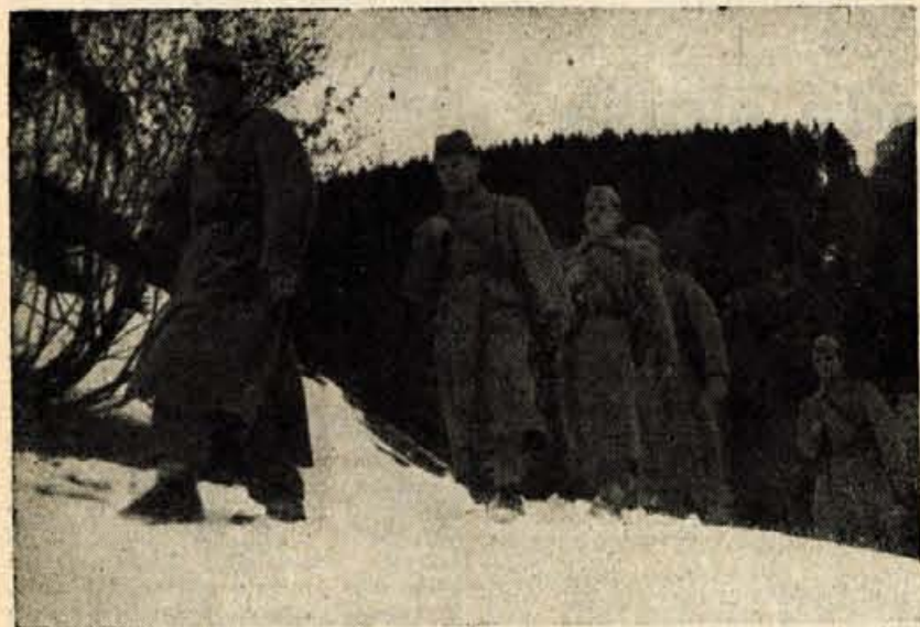
VSAK DAN, OB VSAKI URI SO GRANIČARJI NA POLOŽAJIH