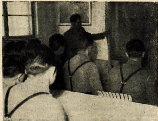
TAKO SE JE MUSTAFI ODPIRAL SVET

Tako se nama je predstavil na videz nekoliko plahi dvajsetletni mladenč — graničar v obmejni karavli »P«. Tja sva prišla namreč s tovarišem majorjem, da bi kaj