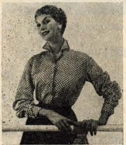
SKROMNO IN LJUBKO

Za mastno kožo uporabite beljak, ki ga pomešajte s 100 g moke, žlice me- du. To mešanico denite na lice za 15 minut. Za tem izmijte oblogo s toplo vodo. Koža bo gladka in dobro nahranjena.