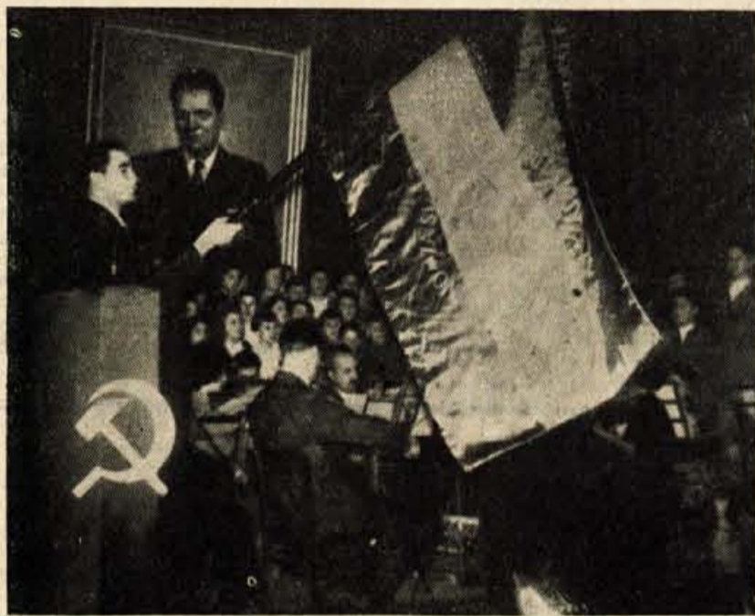
OBČINSKI PRAZNIK V ŠKOFJI LOKI Razvitje novega prapora Zveze borcev NOV

V nedeljo popoldne je organizacija Zveze borcev pripravila v domu TVD »Partizan« družabno prireditev. K. J.