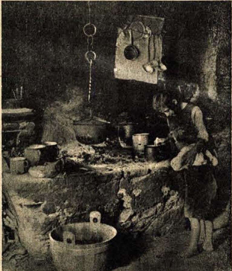
STARA GORENJSKA KUHINJA V STARI FUZINI V BOHINJU

BOHINJSKI KOT, del slovenske Švice, je zgodovinsko pomemben zaradi železarstva, ki sega nazaj v prazgodovinsko in rimsko dobo. Stara Fužina, ki ima slikovito lego na skrajni vzhodni obali Bohinjskega jezera, je dobila ime po fužinarstvu. Še danes so v teh krajih vidni ostanki utrjenih topilnic. Po Valvasorjevem poročilu so topili na Starem kladivu (tako se je Stara Fužina takrat tudi imenovala) mnogo železa in so iz njega izdelovali tudi žeblice. Fužine so bile last Ortenburžanov, pozneje Celjanov in nazadnje Habsburžanov. Leta 1868 je kupila Kranjska industrijska družba vse bohinjske fužine in 1891 je ugasnila zadnja peč. Poleg železarstva so se Bohinjci bavili