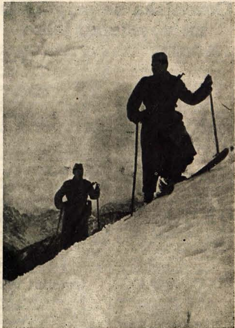
OB DNEVU JLA Smučarska patrolja ob meji