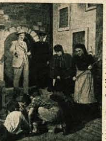
»Ekvinočije na deskah Prešernovega gledališča

Pretrgana umetniška linija in slaba zakoreninjenost v skalo, na kateri stoji gledališka hiša, je en razlog za fluktuacijo publike. V napačnem presojanju v bistvu zdravega okusa