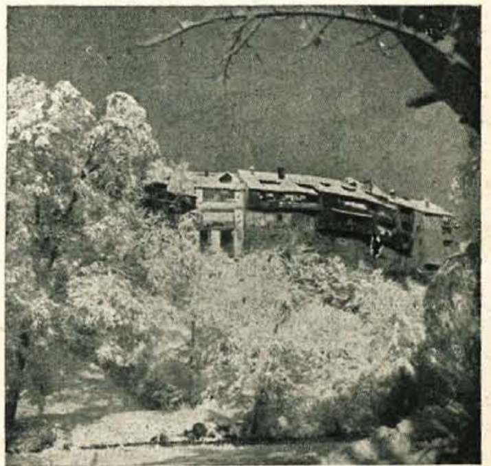
Končno se je zima le usmilla ljubiteljev zimskega športa. Na sliki: Pogled na zasneženi Kranj iz kanjona Kokre.

Danes popoldne bo seja Ljudskega odbora mestne občine v Kranju, na kateri bodo odborniki v prvi točki dnevnega reda razpravljali o poteku zborov volivcev, ki so bili v vseh občinskih volivnih enotah zaključeni pretekli teden. O številnih predlogih in sklepih zborov volivcev smo že pisali, odborniki pa jih bodo skušali na današnji seji vskladiti z letošnjimi finančnimi zmogljivostmi mestne občine. Prav tako bodo odborniki razpravljali o imenovanju nekaterih novih direktorjev podjetij na področju občine, in o konstituiranju novega obrtnega podjetja »Uniforma«. Odborniki bodo izvolili tudi komisijo, ki bo pripravila odlok o uporabi zemljišč za splošne gradbene namene. Ob zaključku seje pa bodo potrdili prve zaključne račune kranjskih podjetij.