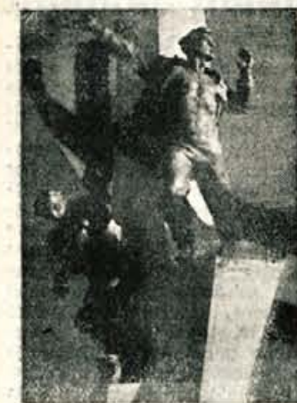
Del novega spomenika

Odkritje spomenika padlim borcem in talcem - članom delovnega kolektiva tovarne »Titan« v Kamniku - je bila ganljiva manifestacija naše hvaležnosti vsem, ki so darovali svoje življenje za boljše bodočnost naših narodov. Na dvorišču tovarne pred upravnim poslopijem se je okrog spomenika, ovitga v zastavo, zbral delovni kolektiv tovarne, svojci padlih žrtev, zastopnik glavnega odbora Zveze