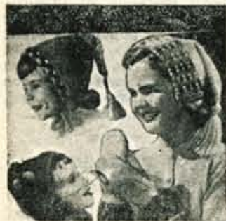
Kajne, da so mične pletene jopice

kaj osnovnega znanja iz krojenja in pletenja je potrebno vsaki ženi, posebno materi. Dekleta, ki posejajo tak tečaj na Primorskem pri Kranju, so z uspehi zelo zadovoljna. V družinskem proračunu se tako znanje dobro obrestuje. Pametno bi bilo v zimskem času organizirati na Gorenjskem čim več podobnih tečajev.