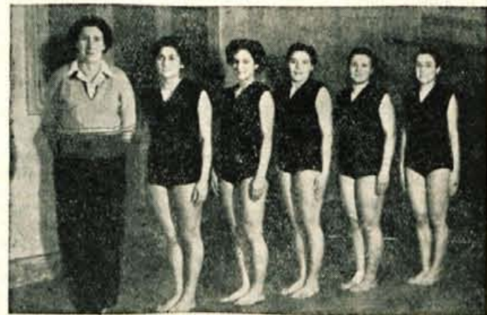
Vrsta članic TVD »Partizan« iz Skofje Loke je ena najmočnejših telovadnih ekip v Sloveniji

Na novem strelišču na Visokem sta bila v okviru prireditve za 29. november dva zanimiva dvoboja strelcev z vojaško puško. V prvem, ki je bil 27. novembra, so strelci »Tiskanine« iz Kranja premagali moštvo z Visokega z rezultatom 309:199, 29. novembra pa so strelci z Visokega doživeli še en poraz v srečanju s Predosljami. Gostje so zmagali s 331 krogi proti 289 krogi.