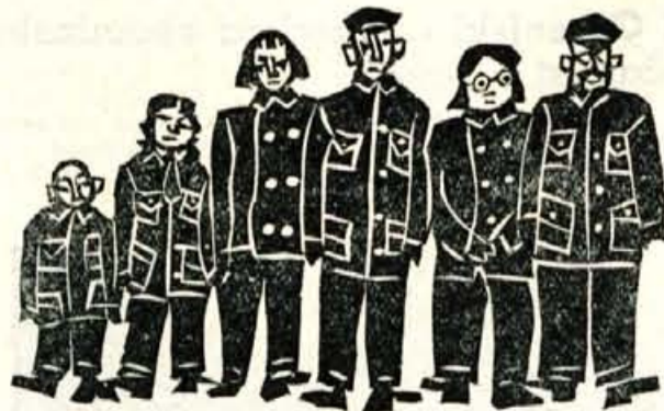
Karikatura iz šanghajskega časopisa »Hsin Min Van Pao« nosi naslov »Deklica je narisala družinski portret — Aluzija na uniformirano modo.

Iz člankov, ki so jih na temo v zadnjem času objavili razni kitajski časopisi za tujino, je videti, da je današnje kitajsko vodstvo spregledalo, da kitajski revoluciji ne bo pravi nič škodovalo, če se bo znebil lastnih neumnosti. Sklicujejo sestanke in na njih pojasnjujejo, da se je včasih sicer res lepo oblačilo samo