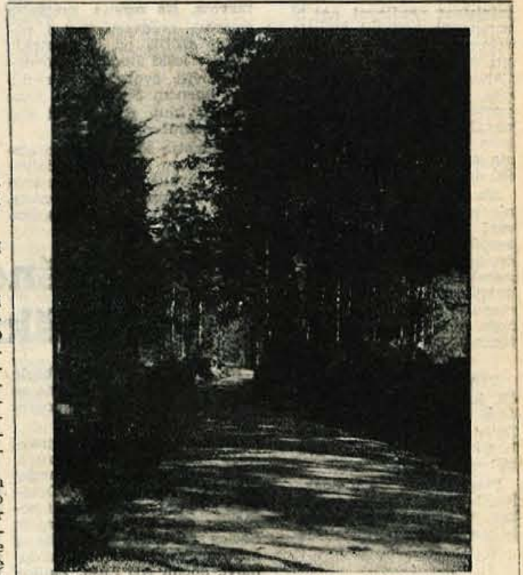
TISINA ... Vse kaže, da se tudi jesen že posavlja, saj nas je pred dnevi že presenetil sneg ... Taki prizori so na Gorenjskem že redki ...

Čeprav so še kar vestno pristopili k organizacijski in propagandni uveljavitvi »Meseca varčevanja« med združnimi organizacijami na Gorenjskem, pa doslej žal niso bili dose-