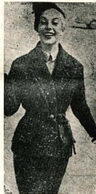
Topli zimski kostimi iz debellega tweeda so letos priljubljena modna novost