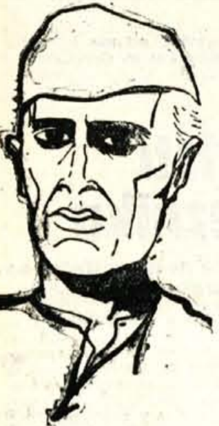
Indijski premier Nehru

Prvič, za to, da v pogajanjih kljub mnogim razlikam v glediščih ne groze, če ne bi sprejeli stališča