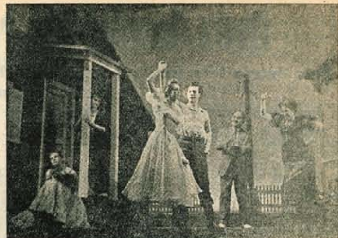
William Inge »Piknik« v Prešernovem gledališču

vseh odgovornih forumov s polnim razumevanjem do nujnosti nemotena delovanja jeseniškega gledališča, ki predstavlja za vso zgornjo Gorenjsko edino in važno kulturno institucijo, gledališki kolektiv zastavlja kljub vsemu vse svoje sile, da zadovolji svojo publiko in izpolni svoje kulturno poslanstvo.