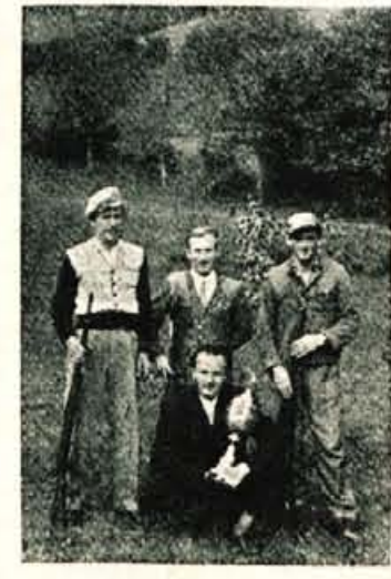
Strelska ekipa, ki je osvojila pokal BPT