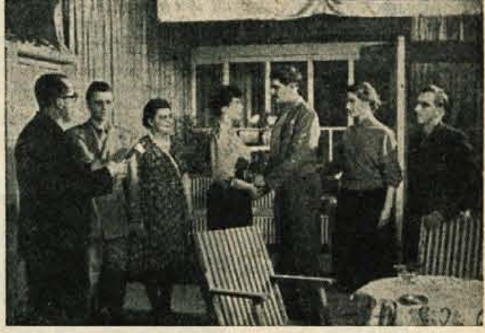
V Lescah so lani zaključili sezono z »Drago Ruth«

predavanj — predvsem o V okvirnem programu letošnje sezone imajo Cankarjevo delo Za narodov blagor, komedija. Za stanovanje gre, spevoigro Naj bo stara ali mlada. Anzengruberjevo Sla-