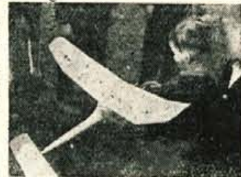
Tudi najmlajši si je želel ogledati model

Kranjčani, pri katerih so največjo pozornost vzbujali motorni modeli in vezane letelce makete, ki so bile v večini