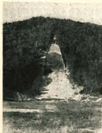
»Mamutska« že čaka...

Ta lepa dolina bi lahko postala turistični biser Gorenjske, če bi bila turistom bolj dostopna - Promet je največja ovira nadaljnjega razvoja - Kako čim bolj podaljšati sezone?