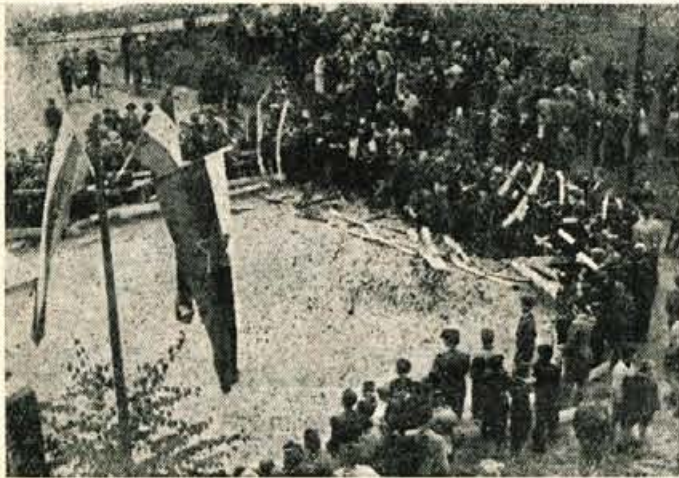
Z otvoritve I. zleta slovenskih modelarjev

Pretekli petek, soboto in nedeljo, je bil v Kranju I. zlet slovenskih modelarjev, ki ga je organiziral kranjski aero klub „Stane Zagar“ pod pokroviteljstvom Okrajnega odbora SZDL za Gorenjsko. Medtem ko je bil v petek samo tehnični pregled okoli 200 najrazličnejših modelov, s katerimi je tekmovalo nad 70 modelarjev iz vse Slovenije, je bila v soboto zjutraj