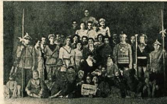
V Tednu otroka so se Ribničani spomnili svojih najmlajših s Sneguljčico

V Bohinjski Beli imajo prav tako še neurejen »Mladinski dom«. Vendar je kljub temu opaziti nekaj uspehov. Lani so naštudirali celo štiri drame, imajo pa tudi delaven pevski zbor in folklorno skupino.