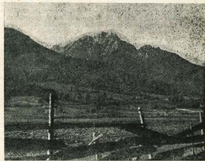
JESEN JE TU... Motiv iz Kranjske gore — v ozadju Ponce (reportažo berite na 4. strani)

V sklepih so predvsem poudarili, da je treba pri sestavljanju takega odloka predvsem upoštevati pašništvo, s katerim je v ozki povezanosti tudi razvoj živinoreje, najdenosnejše in najperspektivnejše gospodarske panoge tega predela Gorenjske.