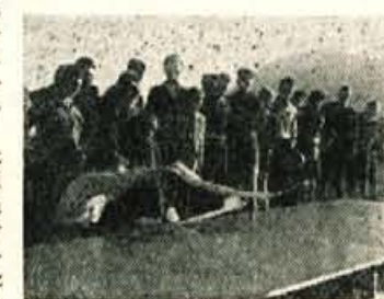
Motorni model na „letališču“ vembra.

Vsi tekmovalci so po končani prireditvi izrazili zadovoljstvo z bivanjem v Kranju in prav tako tudi z organizacijo I. zleta slovenskih modelarjev, ki je prav gotovo mnogo pripomogel k napredku modelarstva in ki nam zagotavlja, da bodo uspehi modelarjev v prihodnosti še bolj.