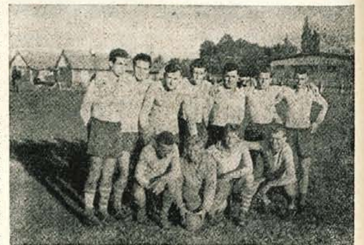
Enajstorica rokometarjev ŠD „Mladost“

di več golov. Da tega preteklo nedeljo ni bilo, je, lahko rečemo, največ kriv Marinšek, ki se nikakor ne more otresti nekoristnega in za moštvo škodljivega „soliranja“. Ver-