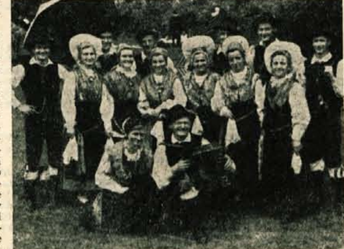
Blejčani so v gorenjskih nošah sprejeli letos že marsikatero visoke goste

Ker je življenje na Bledu zaradi turizma podvrženo nekim posebnim pogojem, bi se temu primerno moralo razvijati tudi kulturno delo. Knjižnica, ki razpolaga z razmeroma lepim številom in izbiro knjig, bi naj v sezoni z različnimi knjigami in revijami pritegnila tudi tujece. Največ pozornje pa bi morali Blejčani vsekakor posvetiti svoji folklorni skupini. Ker je za dramsko sekcijo mrtva sezona na Bledu malo daljša, bi morali vse svoje delo pred zimo vložiti v folkloro. Vsak tujec in tudi domačin si z največjim zanimanjem ogleduje gorenjske noše, kaj šele, če vidi gorenjske plesne — poskočna polka in narodni noši vzbudi veselje in ustvari razpoloženje ter obe-