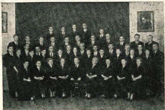
Jeseniški pevci so se vrnili iz Trbovelj, kjer so imeli v počastitev kongresa samostojen koncert

danjih svobodašev skoraj ni več. Izkrjavili so v bojih med Narodnoosvobodilno borbo. A njihovo delo in duh živita v zavesti nove generacije. O tem pričajo tudi temeljite priprave na kongres. Ko so nekdanji svobodaši našli prostor za svoj marksistični krožek globoko v sencah pododrja, najbrž niso predvidevali, da jih bodo tako kmalu zamenjali novi ljudje, ki bodo udobno sedeli za lepo opremljeno čitalnico in prebirali tu revije in knjige z vseh koncev sveta. Niso se nadejali, da bo v tako kratkem razdobju obrodila sad njihova setev. Po dobrih dvasjetih letih, po viharni, ki je do temeljev pretresel našo zemljo, stojimo bolj kot kdajkoli trdno pripravljeno, da izpolnimo oporo nekdanjih svobodašev: da iz korenin, ki so trdno vsajene, razvijemo močno kulturo delovnih ljudi, ki bo last vsakega delavca in v kateri se bo vsak delavec močno izživljal. Prav gotovo bo izredni kongres našel pota, ki bodo še določeneje vodila k temu postavljenemu cilju.