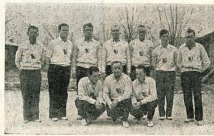
Moštvo kegljačev KK „Jesenice“

Ostale tekme v I. skupini v nedeljo 30. t. m. odpadejo zaradi gostovanja reprezentance v Celju. Redno nadaljevanje prvenstva GNP bo 6. no-