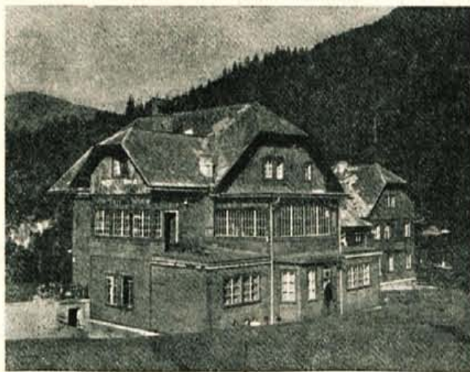
Hotel »Erika« je razen »Doma Franca Rozmana« najmodernejši hotel, čeprav je imel že 20. rojstni dan