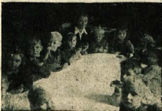
Otroci v vrtcu na Jesenicah