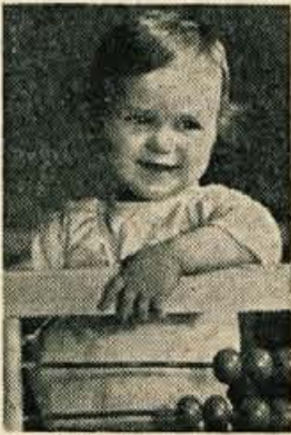
Prijetne so urice v otroških jasilih

Ta in naslednji teden bodo po vseh šolah v okraju prvi roditeljski sestanki v letošnjem šolskem letu.