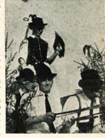
Ko so prišli v Zalog, Velesovo, Brnike, so bili svatje že veseli. Povsod so jim postavili pregrade...

Razstava je pokazala prav dobro stanje živinoreje pri vseh štirih zadrugah, tako da ne moremo delati razlike med njimi. Vendar napis »Krava pri gobcu molze«, velja.