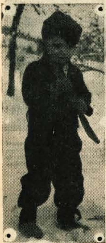
Pionir s puško