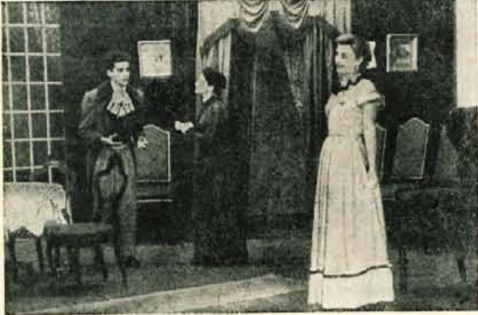
Prizor iz Cankarjeve komedije »Za narodov blagor« na Škofjeloškem odru

Kljub temu, da idejni vse- binski tega daleč nesodobnega dela, res ne moremo zapeti hvalnice, je treba pribiti, da je malo del, ki bi nudila igral- cu tolikšno možnost umetni- škega razvoja in kreativne- ga razpona. Menim, da je v tej predstavi vsakdo lahko spoz- nal in doživel, da tudi delo z najmanjšo zasedbo (takih se Kranjska publika boji!) lahko tudi gledalcu enakoveren estetski užitek kot dela s ko- plico nastopajočih oseb.