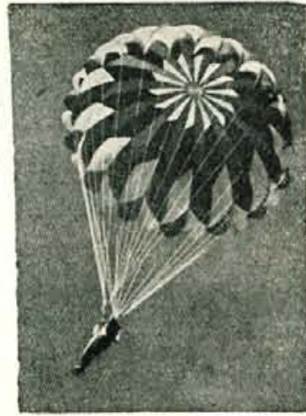
Med tekmovanjem sta dva palca izvajala tudi propagandne skoke

V okviru proslav ob 10-letnici ustanovitve aerokluba »Stane Zagar« v Kranju je modelarska sekcija priredila klubsko modelarsko tekmovanje za naslov najboljših modelarjev v posameznih kategorijah.