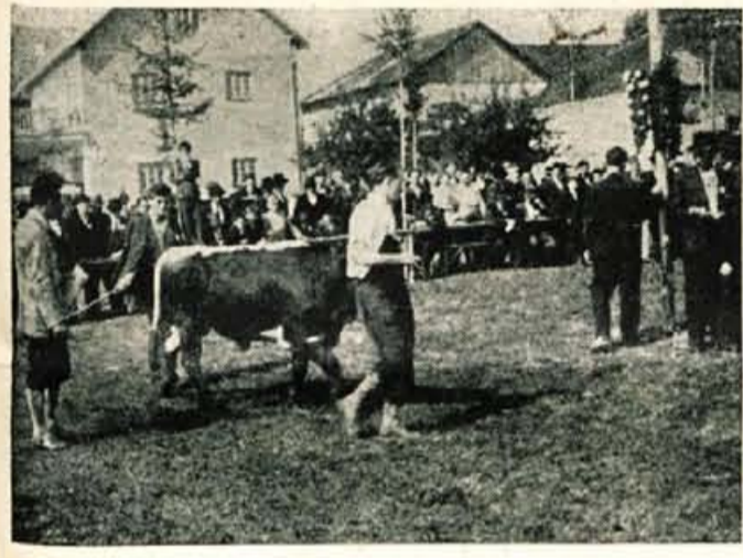
»Kolikokrat bom še peljal kravo v krogu?« se je vprašal marsikateri živinorejec, ko je vodil svojo živino okoli ocnjevalne komisije, ki je bila neizprosna...