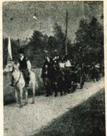
Tako je bilo, ko so vozovi »kmečke občeti« s starešino, ženinom in nevesto odšli iz Cerklj... Veselo, z vriskanjem so se poslovili...

Več ljudi, več vnetih zadrugnikov in organizatorjev bo mnogo lažje opravilo veliko delo. Uspeh pa bo pri tem neprimerno večji!