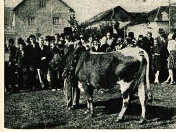
Dobila je »krancel«... Krava »Naglica«, rodovniška številka 308, last Petra Stularja iz Lenarta št. 1