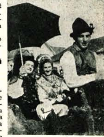
Zenin in nevesta se smehljata. Vesela sta in srček jima igra... Na kaj le mislita...?