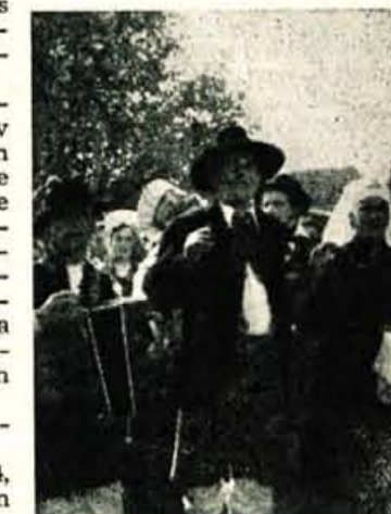
»Ali nas boste pustili noter, kaj?«, je vprašal starešina. »Saj nismo nepridipravi. Zenin in nevesto imamo s seboj!«