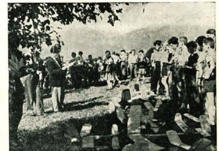
Otvoritev prvenstva modelarjev aerokluba »Stane Zagar«