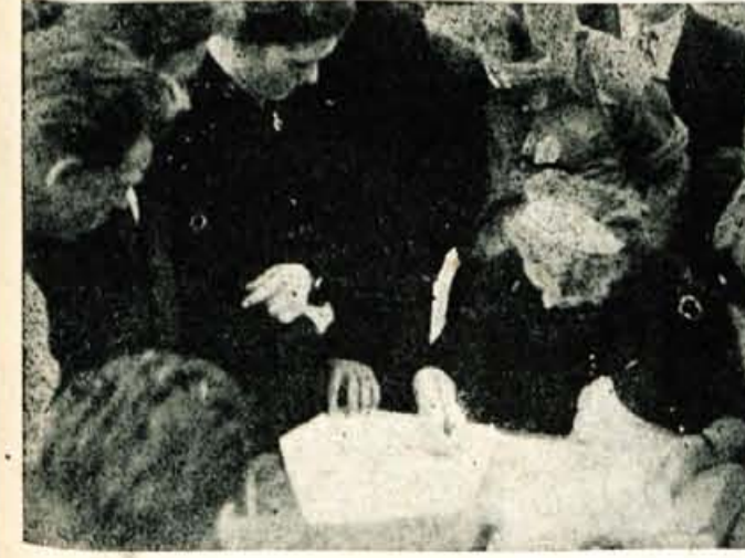
Nagrade so bile mikavne... Zato je bilo okoli tovarišice, ki jih je delila, vedno polno interesentov...