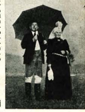
Starešina je bil najbolj »štiman«... Vendar ves čas ni bil tako resen, kot je tu na sliki...