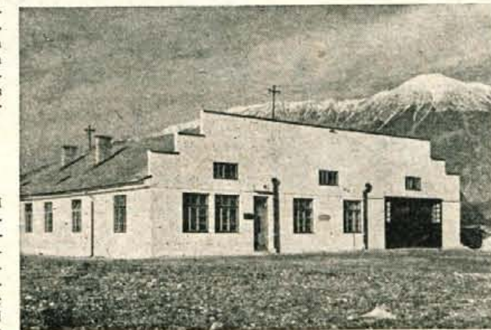
Nova stavba podjetja »KEM« na Lipcah

Z zdravo komercialno politiko in s pomočjo gospodarskih organov se bo lahko »KEM« v kratkem razvil v pomembno gospodarsko podjetje na Gorenjskem, še prav posebno zaradi tega, ker nameravajo že letos začeti z gradnjo lastne livarne. A.