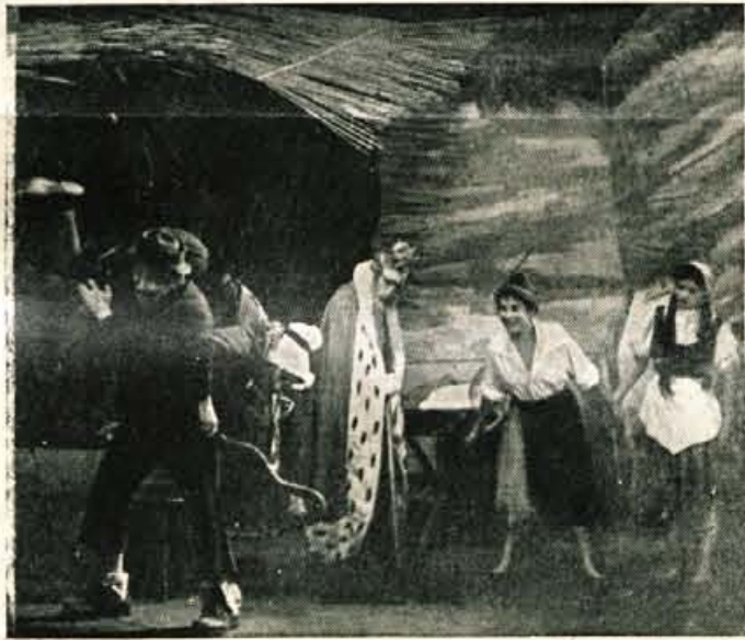
Prizor iz mladinske igrice »Pastirček Peter in kralj Briljantina«.

Posamezna jeseniška podjetja bodo poklonila vsem tistim, ki jih bo občinstvo izbralo za najboljše, nekaj praktičnih daril.