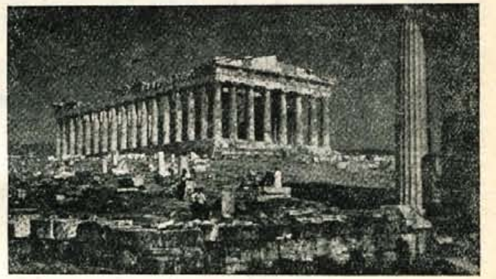
Najlepša umetnina starogrške arhitekture — Partenon

Dvigajoča se trioglata zastavica pred Korintskim prekopom je opozarjala, da je prehod prost, da bodo krmilo prevzele grške roke. Počasna pot tu skozi je bila lepa, ska-