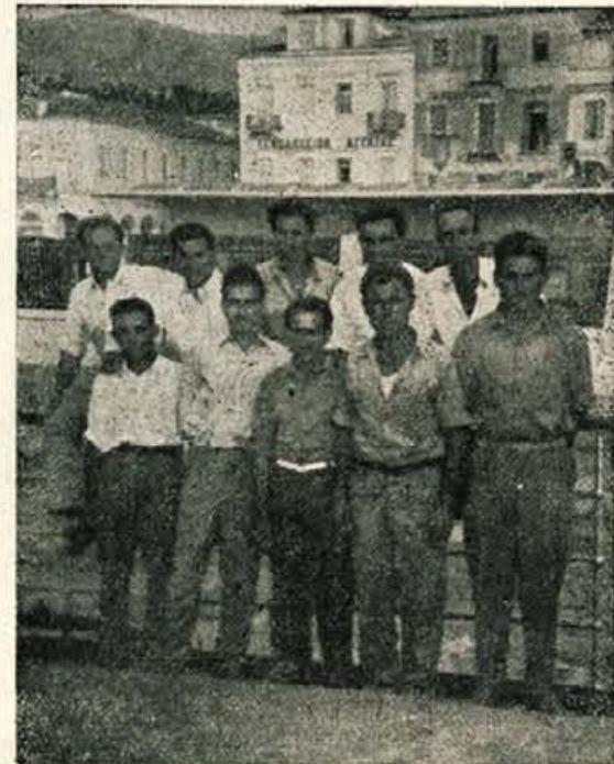
Posadka iz potopljene ladje »Potok« brez kapitana na povratku domov

In čez deset ur so se zna- Tega snidenja mōzje ne bodo šli, na kraju svojih moči, na nikdar pozabili. Grške žene nekem nenaseljenem otoku, so jim s svojo toplino, srč-Nekateri so bili še komaj pri nostjo in dobroto nudile prvi življenju, drugi pa so zbrali dom. Ne da se povedati koll-