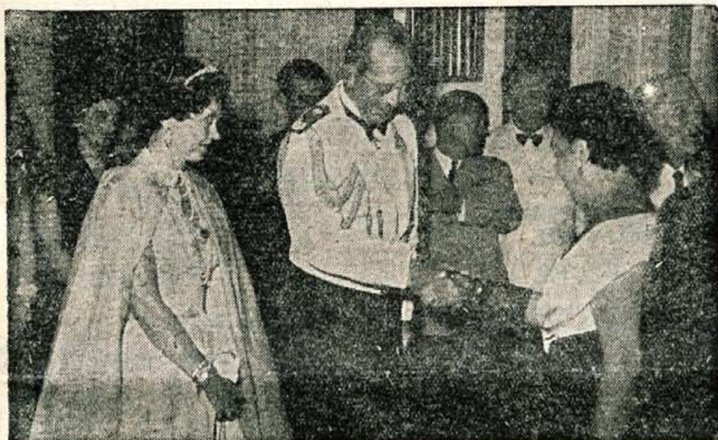
Grški kraljevski par se seznanja s povabljenici na slavnostnem sprejemu na Bledu

soke goste z njihovim spremstvom pozdravila Gorenjska. Vsa pot od Mednega do Medvod in dalje proti Kranju je bila svečano okrašena z jugoslovanskimi in grškimi zastavicami. Na Laborah je bil tudi mogočen transparent z geslom, ki je pričal o grško jugoslovanskem prijateljstvu. Od Labor skozi ves Kranj pa so kolono avtomobilov z visokimi gosti pozdravljale številne zastave in precej ljudi. Žal