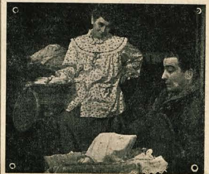
Prizor iz drame Jan de Hartoga »Pod nebom zakonske postelje«

sredo 21. t. m., četrtek 22. t. m. in soboto 24. t. m. v Prešernovem gledališču v Kranju ter v nedeljo 25. t. m. popoldne ob 16. uri in zvečer ob 20. uri v gledališču na Jese-