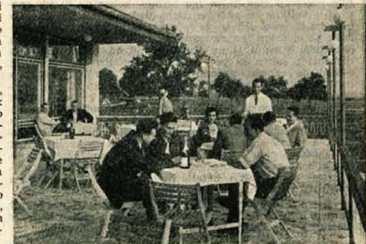
Prijetno je posedeti na verandi restavracije na letališču v Lescah

je opravilo zanj prevoze. Takoj je »Ribnik« moral voziti svojo robo mimo letališča v Lescah na letal. v Ljubljano in dati zaslužek tujemu prevoznemu podjetju. Takih primerov pa je še več. Ze teh nekaj primerov kaže, da ima bodoče podjetje dobre perspektive. Računati pa morajo kurenca in zato tudi ne čuti potrebe, da bi prilagodil listje potrebam našega gospodarstva in potnikov ter tudi cene približal njihovim možnostim, ampak te stvari uravnava po lastni uvidevnosti. Prav gotovo bo ustanovitev takega podjetja pomembna za gospodarstvo na Gorenjskem