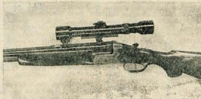
Lovska puška „Bock“ — proizvod kranjske puškarne

Zaradi članka „O odnosih vodilnih uslužbencev do javnosti“, priobčenem v 33. številki našega lista, 13. avgusta letos, so se kranjski puškarji pritožili, češ da omenjeni članek lahko vrže napatno luč na njihovo delo in uspehe, ki so v zadnjih mesecih precejšnji. Prav zaradi teh uspehov objavljamo naslednji članek: