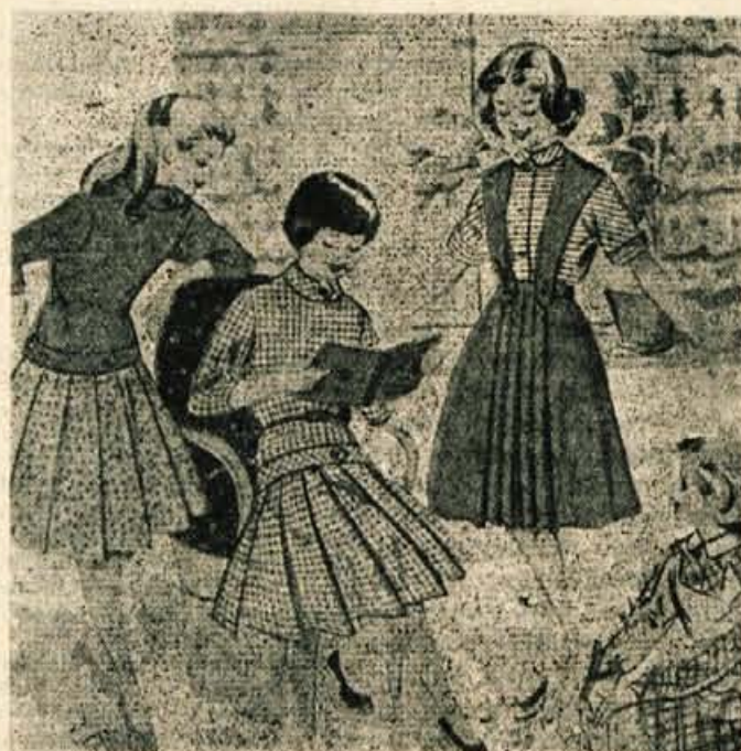
Nekaj obleke za naše deklice, ki bodo šle v šolo