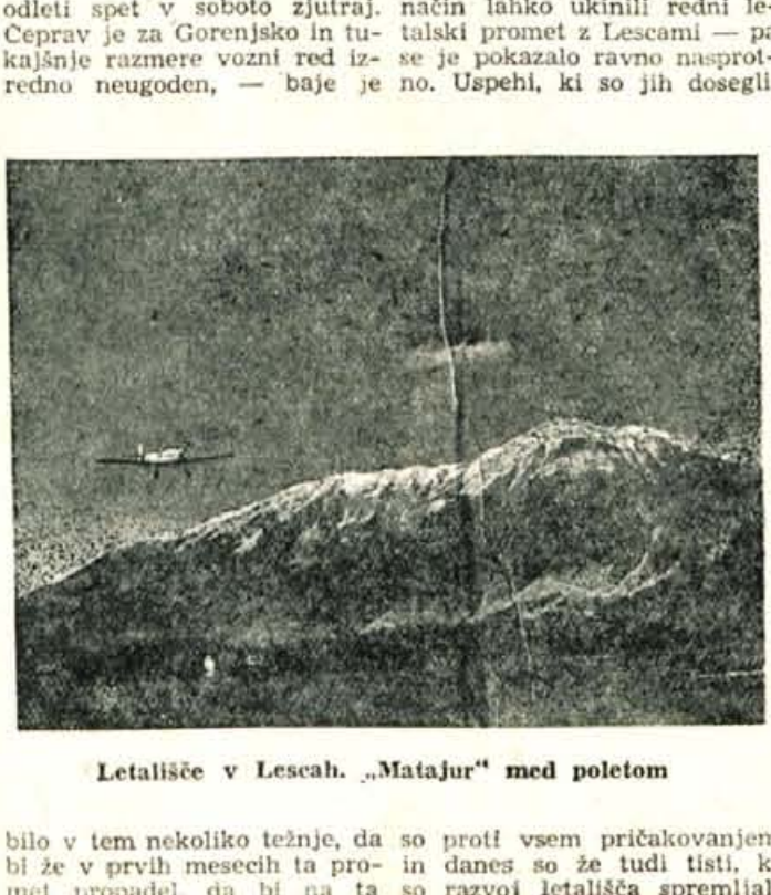
Letališče v Lescah. „Matajur“ med poletom bilo v tem nekoliko težnje, da so proti vsem pričakovanjem bi že v prvih mesecih ta pro-in danes so že tudi tisti, ki met propadel, da bi na ta so razvoj letališča spremljali

Pravkar je pristalo na letališču potniško letalo JAT „Duglas“, ki vzdržuje redno tedensko letalsko zvezo z Ohridom, preko Zagreba in Beograda. Ljudje izstopajo. Tu vidimo turiste, službene potnike, diplomate in druge. Med njimi je 9 ali 10 potnikov, ki nosijo s seboj neke palice. Kaže, da so ribiči, ki gredo k Savi Bohinjki. Po narodnosti so Angleži. Med potniki smo opazili tudi grškega in turškega veleposlanika in še nekatere druge. Nasplošno je na letališču, odkar je bil vzpostavljen redni letalski potniški promet, živahno. V novi pristanišni zgradbi so prijazno in udobno opremili gostišče in uredili tudi ostale prostore. Tu se dnevno ustavljajo domači in tuji turisti pa tudi drugi potniki, in ob kozarcu pijače opazujejo življenje na letališču, ki je tako zanimivo, da v slehernem vzbudi željo po letenju. Nehote se zagleda človek v višave ter spremlja polete jadranih letal, pristajanje itd. Potniško letalo pristane v Lescah ob petkih popoldne in