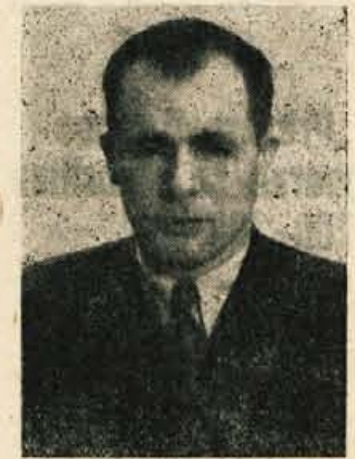
(Nadaljevanje s 3. strani)

Pri formiranju svetov so nastale v naši občini bistvene spremembe, kajti namesto sedanjih treh svetov smo formirali sedem novih svetov, ki bodo v bodoče delovali pri ljudskem odboru. Posebnost spremembe je v tem, da bo obstojal poseben svet za gospodarstvo in poseben za komunalne zadeve in gradnje, od katerih bo prvi obravnaval družbeni plan in opravljal zadeve s področja gospodarstva, vodnega gospodarstva in financ, drugi pa zadeve s področja urbanizma, gradbeništva, prometa in cest. Razen sveta za prosveto in kulturo bo obstojal nov svet za šolstvo, ki bo opravljal zadeve s področja šolstva in predvojaške vzgoje v šolah, dalje svet za zdravstvo, svet za socialno