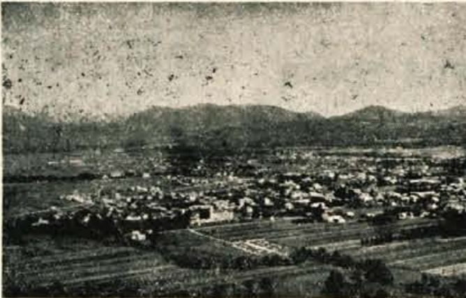
Pogled na Domžale z zraka

vključeni v 23 osnovnih organizacijah. Od tega je 10 organizacij v podjetjih. Tov. Troha je ugotovil, da je delo komunistov zelo pomanjkljivo, kar se predvsem odraža v osnovnih organizacijah v oddaljenih krajih občine. Tej nedelavnosti so predvsem krivi komunisti, ki se z različnimi neutemeljenimi in izmišljenimi izgovori branijo vsakega dela. Precej komunistov je takih, ki menijo, da svojo partijsko dolžnost izpolnjujejo že s tem, če se redno udeležujejo sestankov svojih osnovnih organizacij in če plačujejo članarino. To pa je že v osnovi zgrešeno. Komunist je v svojo osnovno organizacijo vključen predvsem zato, da od nje prejema navodila za njegovo delo na terenu in da njej odgovarja za svoje delo. In ravno zaradi tega se vse