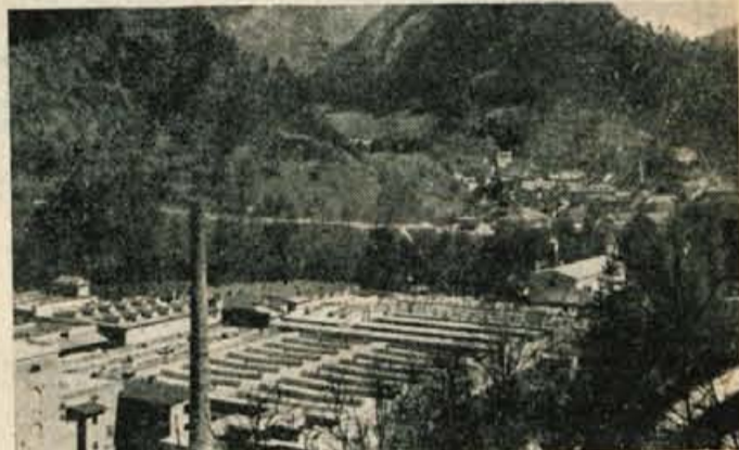
Bombažna predilnica in tkalnica v Trziču

Decentralizacija in demokratizacija našega družbeno političnega življenja je zajela tudi „Bombažno predilnico in tkalnico“ v Trziču, kjer je bil 14. maja 1950 izvoljen prvič v zgodovini tovarne Delavski