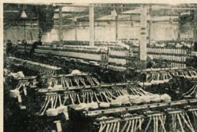
Na sliki vidimo predilnico, oddelke Bombažne predilnice in tkalnice iz Trziča

70 let precej pomeni za tako tovarno kot je Bombažna predilnica in tkalnica v Trziču, toda najsvetlejšje obdobje dela in razvoja tovarne je nedvomno ono po osvoboditvi, ko je delovni kolektiv, zavedajoč se svojega poslanstva, ustvarjal nove socialistične delovne odnose. Ni prav nobenega dvoma, da bodo s takim elanom nadaljevali tudi v prihodnje ter dali našemu potrošniku še več blaga kot doslej ter s tem pomagali dvigati življenjsko raven našega delovnega človeka.