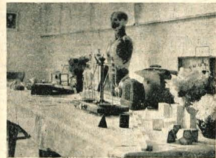
Razstavljena učila, ki so jih prispevali Svet za prosveto in kulturo OLO Kranj in podjetja

Brez dvoma tvorijo osrednji problem nemotenega prometa v Selški dolni mostovi. Posebno važen je most na Praprotnem, ki je sedaj sicer zaslon popravljen. Nikakor pa ne bo smelo ostati samo pri tem popravilu, ampak bo treba slej ko prej obnoviti nekdanji železobetonski most. To obnovo narokuje predvsem povečani promet, ki je nastal s prikličitvijo Primorske na cestno omrežje LRS in z dograditvijo alpske ceste iz Selške doline v Bohinjsko dolino. Nujnost postavitve novega mostu, se je posebno ostro opazila pred nekaj tedni, ko je zaradi popravilnega tega objekta za več dni skoraj zastal promet po dolini, kar je marsikoga, ki je to komunikacijo podcenjeval, spravilo v začudenje.