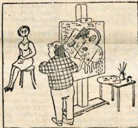
»Kako naj Vam naredim portret, ko pa stalno menjate izraz obraza?«