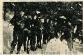
Kurirji rel. stanice G-35 nad Tržičem, kateri so vzdrževali vezo med Dobročo pri Tržiču in Kortami na Koroškem

Z vedno večjim razmahom narodnoosvobodilne borbe, pa sta bili v januarju 1944 postavljeni na Gorenjskem dve poti. Prva pot, na desni strani Save, je vezala njen lev breg s Primorsko in čez Dolomite Dolenjsko. Druga pot pa je vezala lev breg Save z desnim na eni strani, na drugi strani pa Koroško, Štajersko in Dolenjsko. Spomladi 1944 pa so bile na Gorenjskem že štiri relejne poti, katerim je poveljeval štab IV. relejnega sektorja. Sedež štaba je bil v Selški dolini. Ob koncu leta 1944 je bilo na področju IV. relejnega