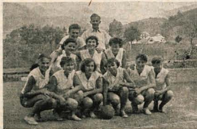
Mladinke SSD Kamnik, ki so bile lansko leto republiške prvakine

Kamničanih kljub precej kvalitetni igri skoraj ne moremo govoriti.