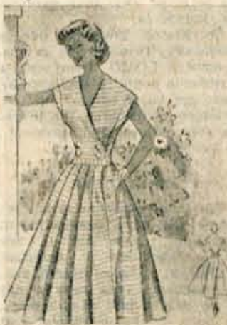
Ljubek model poletne obleke, za progaste tkanine. Zivotek je komaj opazno podaljšan, krilo pa je nagubano.