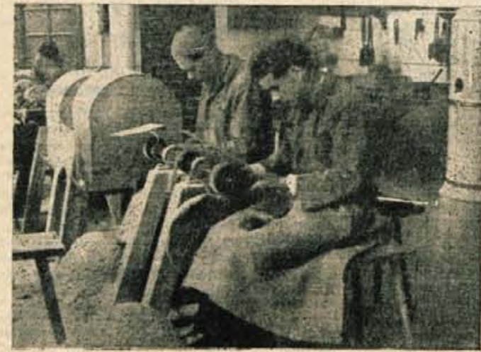
Delo v Bernikovi delavnici

jih delajo tudi na Gorenjskem, to verjetno ve le malokdo, razen tistih, ki so doma v Skofji Loki ali njeni okolici.