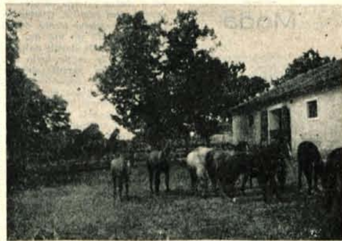
Med iskrim lipičanci nam je bilo posebno prijetno

Ogledovanja še ni bilo konec. V posebni zgradbi — hlevu, so bile močne kobče. Njihova usoda je bolj klavrna. Ko jih na