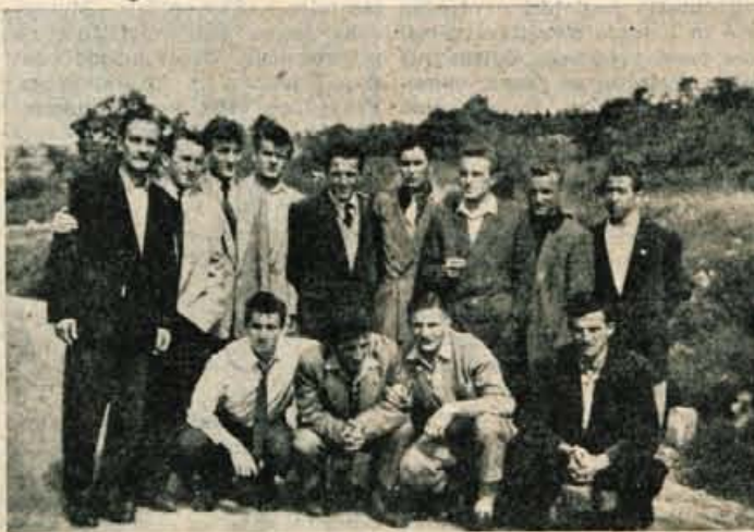
Naj vas slika ne zapelje! Čeprav so dobre volje, jim prav gotovo noge drgetajo, ko so se slikali med vožnjo v Piran

sednik kluba, »vendar pa je to veliko manjši problem kot sredstva, zaradi katerih smo večkrat v velikih zagatah.