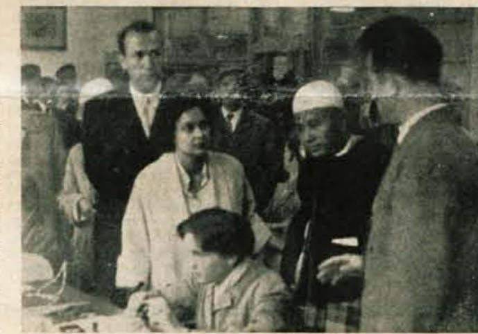
Predsednik burmanske vlade U Nu si z zanimanjem ogleduje proizvodni proces v montaži instrumentov

Na drugem delu seje so razpravljali tudi o mizarskem podjetju v Kranjski gori. Upravniki tega podjetja je bil »dodaj kriminala in malomarnega poslovanja obojen na več let zaporu, vendar s tem vprašanja v podjetju še niso rešili. Vse kaže, da o teh vprašanjih v Kranjski gori precej neresno razpravljajo tako na občini kot v organizacijah. To je edino proizvodno podjetje v gornjem delu doline, zato OLO meni, da je potrebno da ostane. Vendar so podjetje samovoljno zaprli, delavce poslali na brezplačen dopust, knjigovodja, ki imel nalogo urediti obračun pa si je