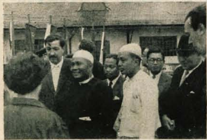
S sprejema na dvorišču tovarne »Iskra«

Sobota, 11. junija 1955. To je oblastvenih forumov, da pozdrabil velik dan za delovni kolektiv visokega gosta. Zbrali so tiv »Iskra« v Kranju. Ta dan jih se predsednik Delavskega sve-