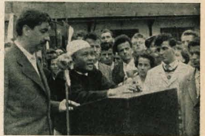
»Delate dobro«, je dejal zbranim delavcem predsednik U Nu ob zaključku svojega obiska v »Iskri«

V montaži telefonskih slušalk centrala osebno preizkusil njihovo de-