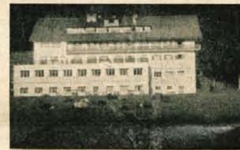
Hotel na Pokljuki

Z velikim svežnjem smrekovih vej privezanih za kolo sem naslednji dan previdno vozil po strmih klancih proti Gorjam. Soteske Vint-