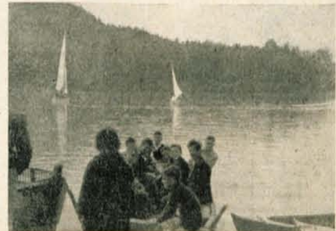
Lepo je bilo na Zbiljskem jezuru