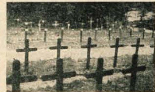
Ob Bohinjskem jezeru sem si ogledal tudi pokopališče iz I. svetovne vojne

Vsaki 5 let imajo pripadniki plemena na Peskadorskem otoku (Novi Hebridi) svoje, za nas skoraj neverjetne, obrede. Iz ravnih stebel naredijo okoli 20 m visok stolp, na katerem imajo na vsakih toliko metrov razdalje skakalne deske. Najnižja odskočna deska je 5 m visoko. S teh desk potem skačejo moški tega plemena na zemljo in tisti, ki ima največ poguma in ki upa skočiti iz najvišjega dela stolpa, je najbolj hraber mož v plemenu. Poglavar plemena pa mora obvezno skočiti z vrha stolpa. Medtem ko skačejo, vsi ostali tudi žene in otroci, pojejo obredne pesmi in plešejo. Često se skoki končajo s težkimi poškodbami, zelo pogosto pa tudi s smrtjo.