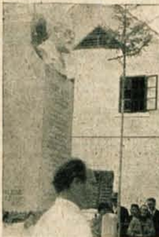
Tajnik KUD Mavčiče je odkril spomenik.

S tem je bil prvi del slavnostne proslave končan, nakar so se vsi zbrali na veseličnem prostoru, kjer je bila kulturna prireditev. Sodelovali so mešani pevski učiteljski zbor kranj-