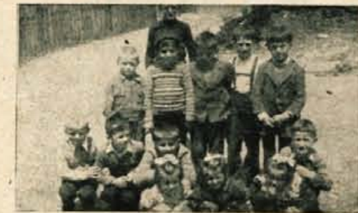
Pionirji iz Srednje vasi so me prav lepo prosili, naj jih slikam

Ne tehtam rad in ne presojam, toda vseeno sem prišel do zaključka, da je le malo modernih (luksuznih) turističnih krajev s tolikimi naravnimi lepotami, kot jih ima Bled. Primerjal sem ga z Vrbskim, Milstadskim, Zellerskim, Züriškim jezerom in Interlaknom. Toda vsi ti kraji so morda bolj moderni, nikdar pa ne lepi. Obvozil sem jezero, ogledal si otok in muzej starih cerkvenih predmetov in podob, ki so nekatere celo iz 15. in 16. stoletja.