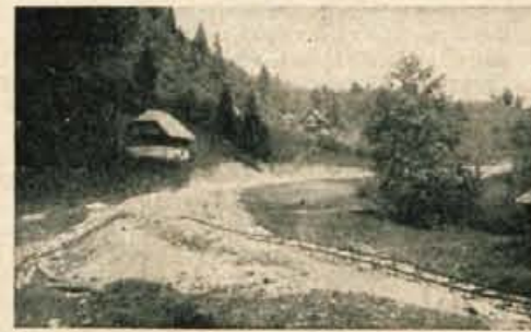
Na gradilišču ceste Gorjuše - Koprivnik je tibo

nec... Po blatnih kolovozih in kravljih stezah sem se dobesedno prebijal na Gorjuše. Bilo je prijetno, a obenem tudi zoporno. Ljudje so me gledali kot da bi bil leteci kroznik (ker je bila nedelja, pač niso imeli drugega dela, kot zijati vame).