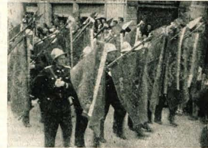
S prapori mimo častne tribune

bodo, kakor je znano, pričele poslovati že s 1. septembrom. Do 1. avgusta bodo dosedanja obč. odbori izvolili iz svoje srede novi odbor komune, ki bo sprejel tudi vse ostale ukrepe in formiral svoje organe. Inicijativni odbor je že pričel s pripravami.