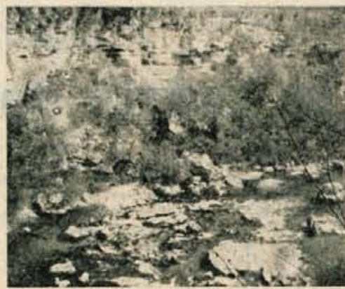
V globoki strugi se penijo besni valovi Save

Globoko pod menoj so se v ozki strugi penili valovi Save in se zaganjali v čeri. Nad pe-