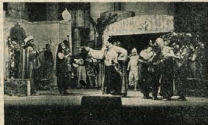
Prizor iz »Hasanaginice«, najbolj uspele uprizoritve Šenčurjanov

v knjižnici hitro raste in obenem se veča tudi zanimanje. Mladi fizikurniki so pri svojih vajah neutrudljivi. Z vsvo voljo in veseljem že dve leti tekmujejo v gorenski ligi. Pravi, da bodo morali s tekmovanjem prenehati, ker nimajo finančnih sredstev. Vendar imajo trdno voljo, da bi se tek-