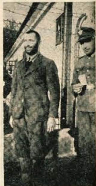
Ujeti partizan v begunjskem zaporu

DAVNO JE ZE splahnel vonj po smodniku, krvi in ognju — dolgo je že, odkar so se posu-