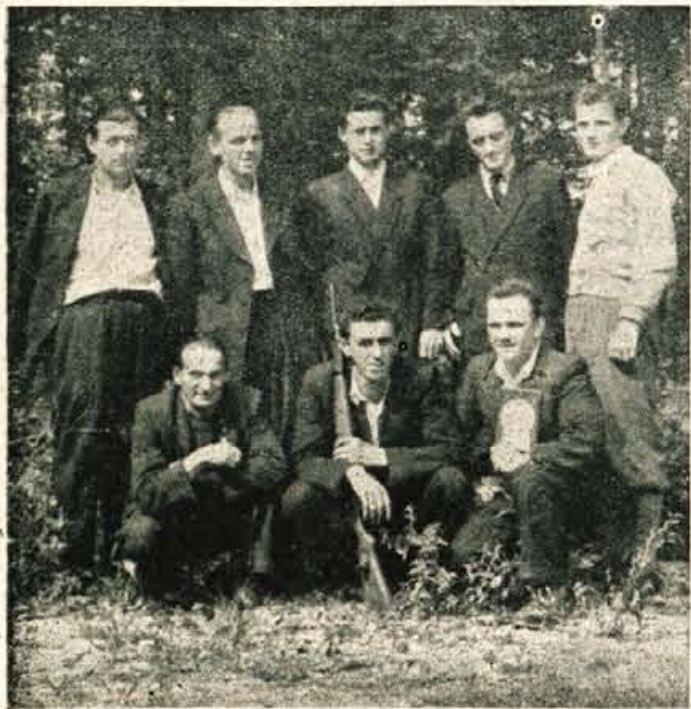
Po tekmovalju na Duplici leta 1954.