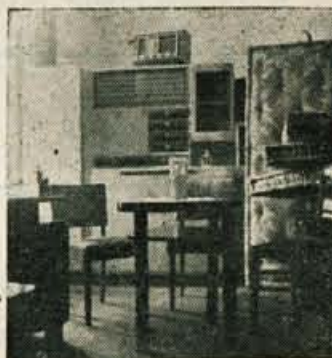
Podjetje ima na razpolago raznovrstno kuhinjsko in sobno pohištvo.

Raznovrstno špecerijsko in manufakturno blago. In ne samo to! Podjetje se peča tudi s prodajo pohištva (kuhinjske opreme, spalnice, divane in vsi posteljno opremo). Kar je najvažnejše in za kupce najkvalitetnejše, pa je brezplačen prevoz pohištva na kupčev dom, čeprav je njegovo stanovanje še tako daleč. To lahko store, ker ima-