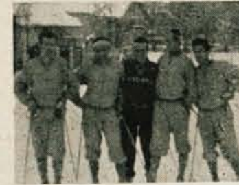
Najhitrejši kranjski tekači

Njega poznajo vsi smučarji. Je zelo prijazen, čeprav velikokrat smučni ne naredi in obljubljenem času, vendar pa smučarji vseeno radi potrpijo, saj jim izdela res