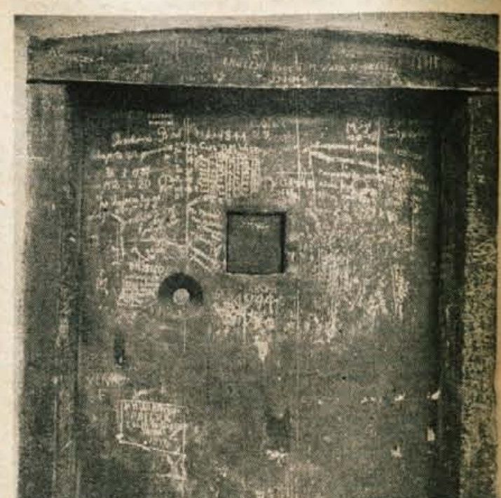
Vrata celice št. 10, ki so jo imenovali »mednarodna«, kajti v njej so čakali na smrt tudi angleški letalci (napis na zgornjem podboju) in ruski partizani (napisi na vratih).

To dekletje je bilo res pomiloščno na počasno umiranje v kakem nacističnem koncentracijskem taborišču — a je pri