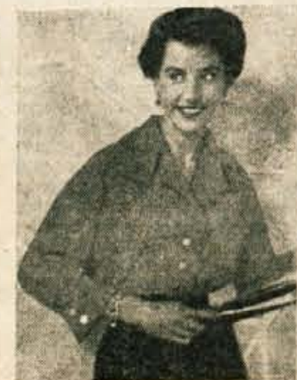
Moderna bluza z apartnim ovratnikom in izbranimi velikimi gumbi