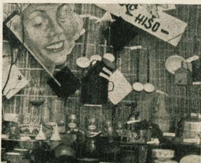
Pogled na eno izmed izložitvenih oken, kjer je razstavljeno najrazličnejše blago.

TUDI V PRIHODNJE SE DELOVNI KOLEKTIV TRGOVSKEGA PODJETJA LESCE PRIPOROČA SVOJIM CENJENIM ODJEMALCEM S PESTRO IZBIRO NAJRAZLIČNEJŠEGA POTROŠNEGA BLAGA IN Z NADVSE SOLIDNO IN VLJUDNO POSTREŽBO.