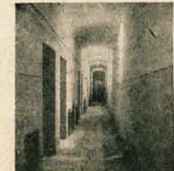
Hodnik — na koncu vidni sledovi streljanja

Niti pogled na osojne vesine hribečka Sv. Petra, kamor so bile tolikokrat uprte okrvavljene in izmučene oči obsojencev niti pogled na prebeljeno zidovje bivših begunjskih zaporov ni