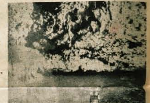
V Arneševi luknji

Sredi divje dežele, ki spominja na slike lunine površine, nastaja čisto novo svet. Zaradi podnebja je mogoče delati le 6 mesecev v letu; zato delajo in kopljejo po 12 ur na dan. V petih letih bo zrasto taborišče Burn Creek v mesto s pet tisoč, taborišče Seven Island pa z 10.000 prebivalci. Plačilo pa bo vredno znojta delavcev: pričakujejo, da bodo ti rudniki mogli kriti potrebe po železni rudi, ki niso ravno majhne, za dobo 100 let.