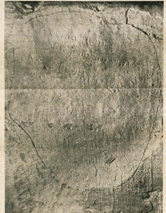
Napis sedemnajstletnega dekleta na steni celice št. 4

»Kot 22- ni mladenič te celice postal sem dedič. V »miru« preiščujem in novo si bodočnost kujem.«