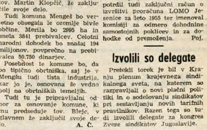
Poslopje zloglasnih zaporov v Begunjah. V nizkem prizidku v ospredju so bili bunkerji. (Glej članek na 4. strani.)

Pretekli torek je bil v Kranju plenem krajevnega sindikalnega sveta, na katerem so razpravljali o novi plačni politiki in o sodelovanju sindikatov pri sestavljanju novih tarifnih pravilnikov. Razen tega so tudi izvolili delegate za kongres Zveze sindikatov Jugoslavije.