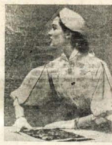
Bela bluza za svečanejšje prilike, kombinirana z ozkim črnim robom na malem ovratniku in bogatih rokavih.

Letošnjo zimo so zelo moderni beli volneni puloverji z visokim zaprtim ovratnikom. Če tak pulover že imate ali pa če ste dovolj potrpežljivi, da ga iz zelo tanke volne spletete same, potem ga lahko okrasite z ostanki raztrgane ogrlice iz belih perl. Perle raztresno uvezite na prednji del života — zgoraj, ali pa jih prišijte na pulover v obliki podkve. Tak pulover je zelo lep, če ga nosimo k ozkemu črnemu krilu. Učinkuje praznično in elegantno, zato ga lahko oblečemo za vse priložnosti.