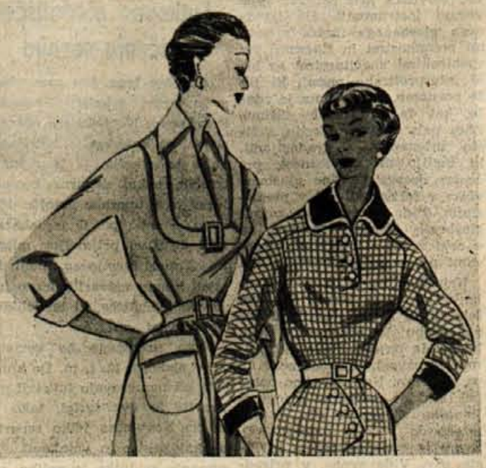
Ljubka modela za dnevne obleke. Karirasto lepo dopolnjuje temnomoder žametast ovratnik, obrobjen z belo svilo in pa manšete iz enakega materiala. Obleko na levi pa krasi našitek na životcu in nekaj nezaljubljenih gub med obema žepoma.