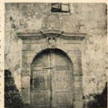
Portal Detelovega gradu v Stražišču iz 17. stol.

Stavba leži pod prelazom, tik ob cesti in v neposredni bližini novega obsejnega gostišča. Preč problem je tudi varstvo spomenikov iz NOV. Številni bunkerji, tehnike, bolnice itd., ki so