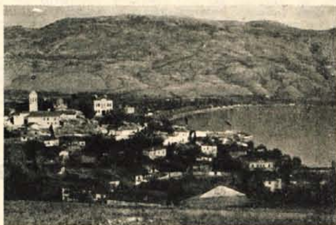
Ob Ohridskem jezeru

Odšli smo pogledat Opero in zvedele, da tisti večer predva-