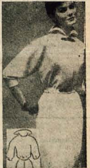
V hladnejših poletnih dneh se bomo odločile za obleko s tričetrtinskimi rokavi, izdelano iz lahke, še vedno svetle volnene tkanine