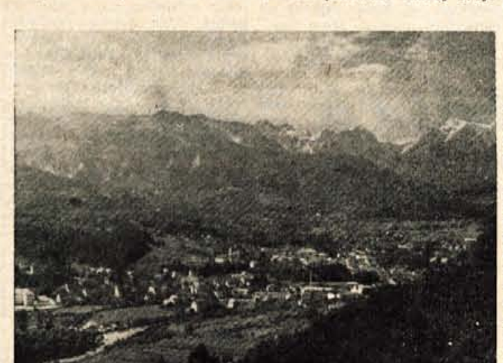
Pogled na Kamnik

Razstava ne bo samo zanimiva, ampak tudi poučna. Tovarne bodo prikazale razvoj svoje