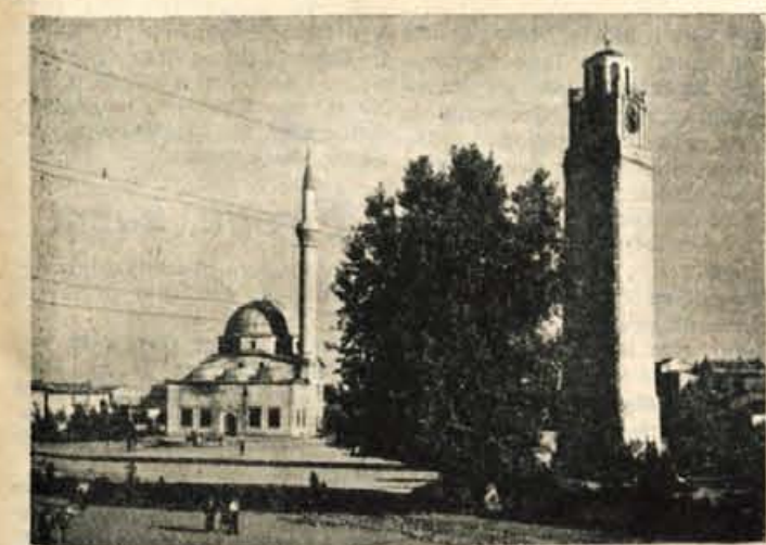
V Makedoniji je veliko džamij z vitkimi minareti

dežja in so polja umetno na-dajala, saj sta nama bili ti dve makali. To je bilo ravno tisti čas, ko so bile pri nas take poljave. Suša je tam doli sploh zelo pogosta in namakanje polj, ki je znano še iz zgodovinskih časov, je sedaj že mehanizirano. Pozneje smo v okolici Ohridskega jezera videli, kako je deček poganjal velikansko kolo, podobno mlinskemu kolesu in tako iz rezervoarja spravljaj vodo v jarko. V muzeju so nam pokazali delovanje take priprave, kjer so imeli v miniaturi izdelan ves namakalni sistem.