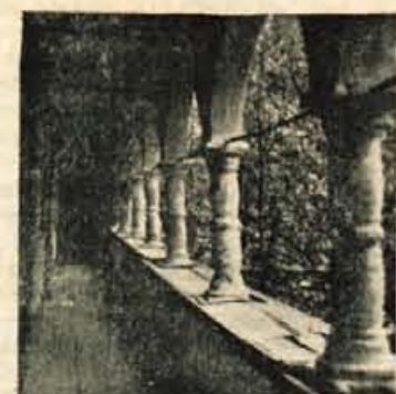
Skofja Loka. Hodnik s stebriči na Spodnjem trgu

Zaradi razbremenitve dela Zavoda za spomeniško varstvo je bila lansko leto pri Svetu za prosveto in kulturo OLO ustanovljena posebna spomeniška komisija, katere namen je inventirati, ohranjati in popularizirati kulturne spomenike in prirodne znamenitosti na teritoriju okraja. Zaradi skromnih denarnih sredstev se je delo komisije moralo omejiti le na po-