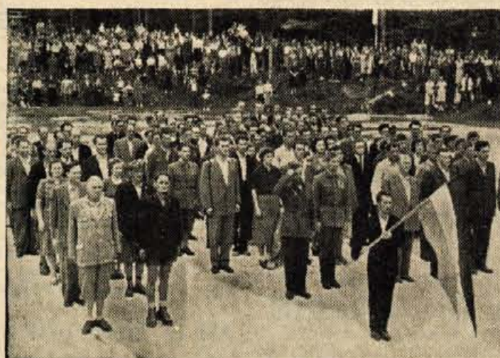
Borci Jeseniško-bohinjskega odreda in VDV-bataljona na parti-zanskem slavlju v Bohinju 22. 8. 1954

Tudi občinske ceste nismo zanemarili. Kar lepo število kilometrov smo lani in letos popravili. Finančna sredstva smo črpali nekaj iz gozdnega sklada, več pa so prispevali kmetje in pa seveda občinski odbor. Za prihodnje leto imamo cel kup načrtov in želja, vendar o tem ne bi rad sedaj govoril, ker ne vemo koliko bomo imeli denarja za investicije in kaj bo res najbolj potrebno. O tem bomo morali še razpravljati in šele potem vam bom lahko kaj več povedal.