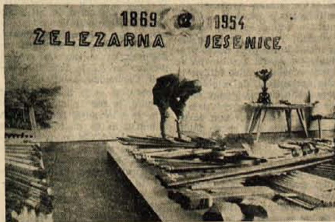
Med najlepšimi razstavnimi prostori na Gorenjskem sejmju je tudi razstavišče Zelezarne Jesenice

Tudi zobozdravnika bi radi dobili v občino. Zato je že lansko leto kmetijska zadruga nabavila ves potreben pribor in tudi prostor za ambulanto smo našli. Le zobozdravnika še ni, ker je vsem naša občina nemara preveč od rok. Tako še danes čakajo instrumenti in prostori nanj.