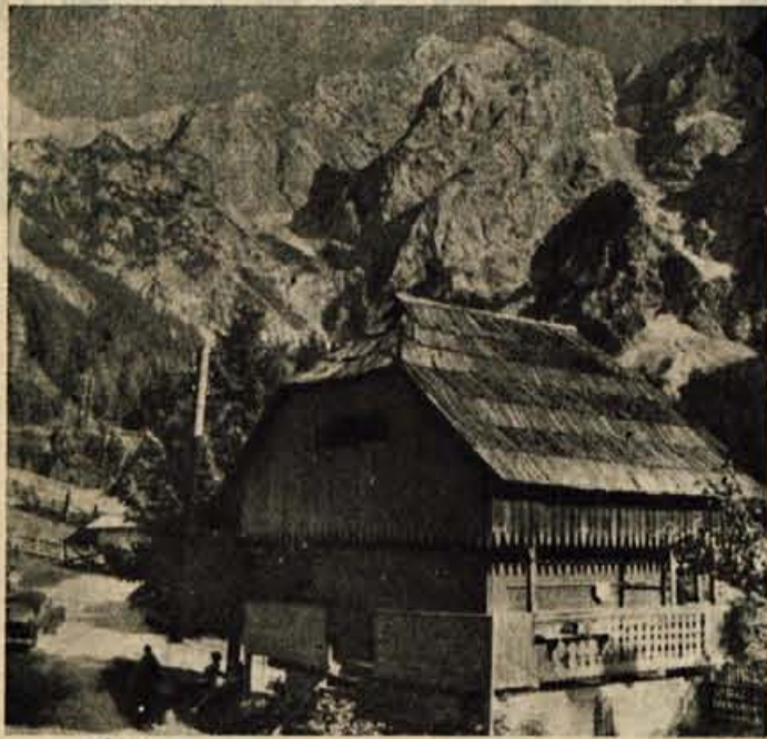
Jezersko — idiličen kraj pod stenami Kočne in Grinoveca, eno najlepših gorskih letovišč v državi, izhodišče za lepe izlete in gorske vzpone — vas vabi!

Zelite morda tudi vi prebiti svoj dopust v tem lepem kraju: Nimate denarja? Nič zato! Še malo počakajte, potem pa boste rešili nekaj zelo lahkih križank, ki bodo razpisane v okviru velikega nagradnega natečaja »Glasu Gorenjske«, in če vam bo sreča mila, boste lahko odšli brezplačno za 14 dni na oddih v DOM NA JEZERSKEM.