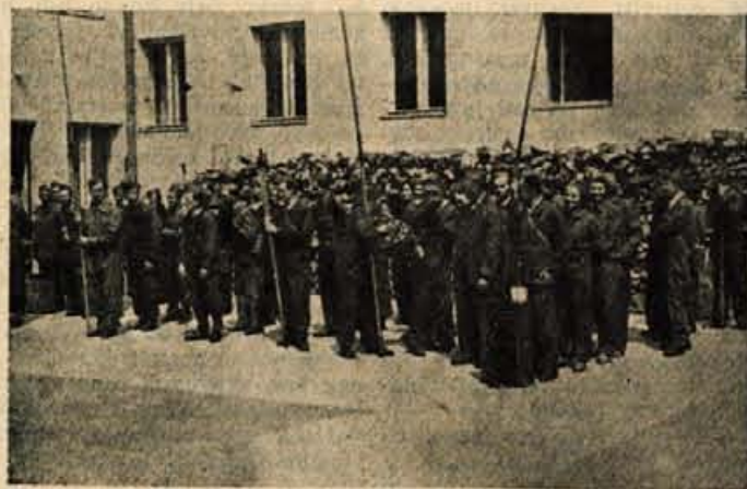
Ekipa pred odhodom na teren

V nedeljo, dne 30. maja, so postarji volili svoje organe delavskega upravljanja. V Delavski svet Okrajne pošte Kranj 1 so izvolili 19 članov. Okoliške pošte so v tem delavskem svet-