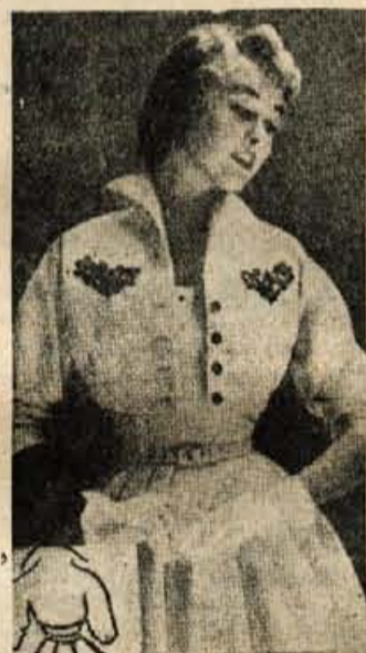
Bela obleka z bolerom za lepe poletne dneve

v barvi. Če bomo dosegli to, potem bomo z majhnimi stroški na poletnem dopustu prav okusno oblečene.