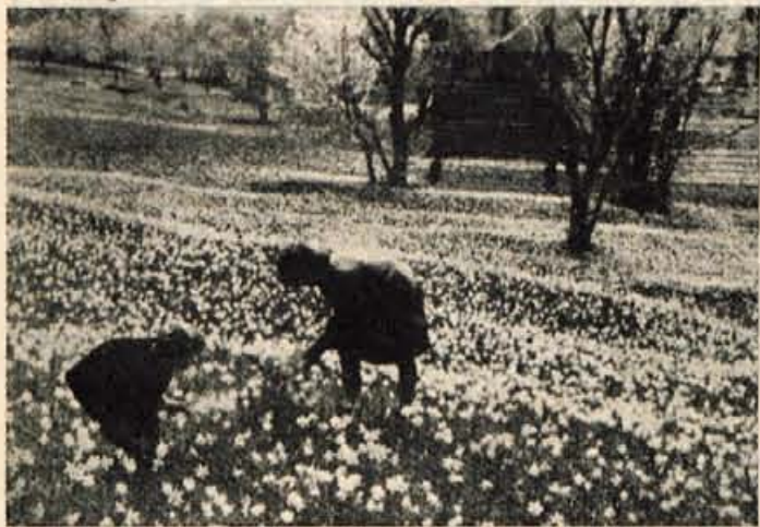
Pomlad in toplejše vreme je končno le prišlo... Kar čez ne bo vse ozelenelo in tudi gore bodo vedno bolj mikavne. Tudi na Golici bodo kmalu duhteče narcise pobelile travnike.