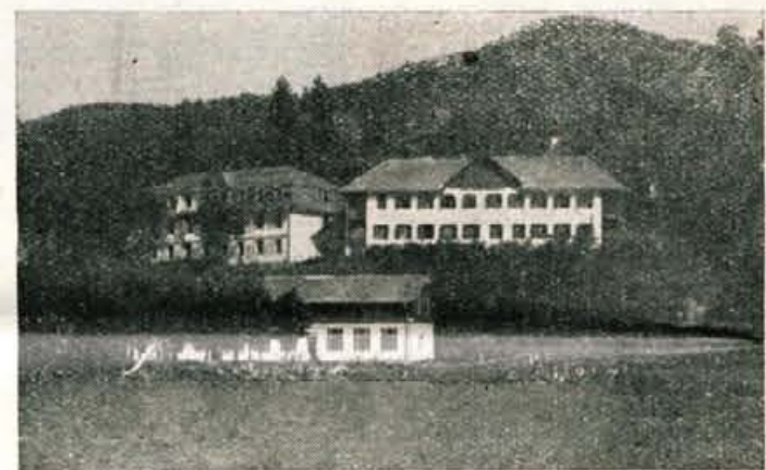
Sekira ob Vrbskem jezeru, kjer so preživeli poletni oddih mnogi slovenski pionirji

Tako tudi pionirji. Dan republike jih spominja, da živijo v svobodni domovini, do katere imajo velike dolžnosti. Radostni so, da je tako. Zato vam k Dnebniki jih spominja, da živijo v republike čestita tudi stric Kosobrin