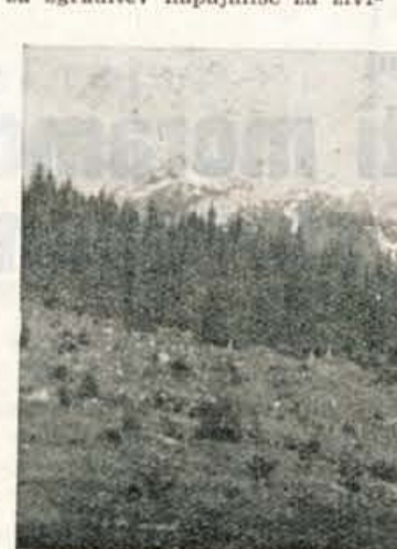
Zanemarjeni pašniki na planini Javornik

Prihodnje leto bodo pričeli s sistematično obnovo planin. Vse grmovje in gozdiče bodo posekali, za les dobljeni denar pa uporabili za obnovo pašnikov in za zgraditev napajališč za živino.