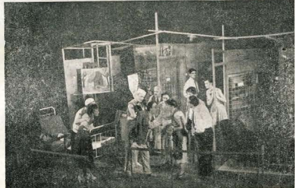
Prizor iz »Šestega nadstropja«

vana, poštenost nagrajena, čisto v skladju z življenjsko resničnostjo velemestnih stanovskih kasarn. Tudi tako nalivno in skonstruirano odrsko dogajanje bi se ne bilo razlog za anatomiziranje avtorja, če bi le-ta znal snov pregnesti s šegavimi duhovitostmi in zabavnimi intermezji, če bi nam jo predstavil kot malo ironično in rahlo moderno velemestno pravljičjo za odrasle. Vendar obdelava te snovi ne izpričuje večjega mojstra, kot njen izbor.