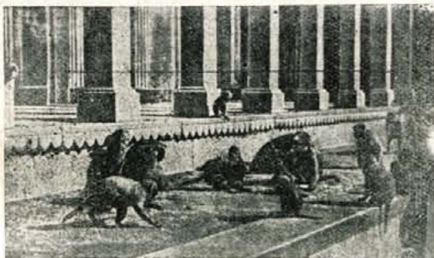
Opice so v Indiji tako vsakdanji pojav, kakor pri nas psi — in mačke v tistih krajih, kjer ni italijanske vojske

pač 10 rupij krajevnamu policistu, da nam ne bi delal še drugih sitnosti.