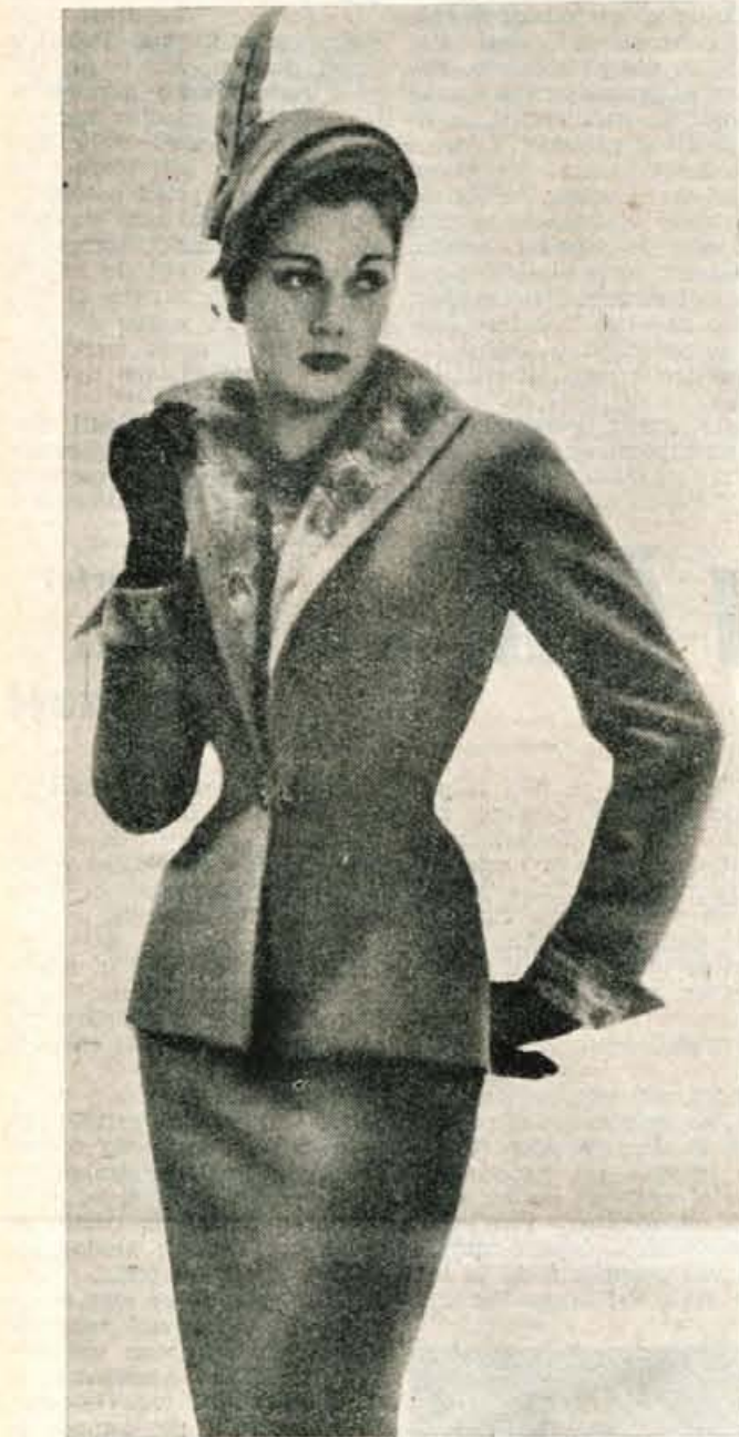
Eleganten jesenski kostim