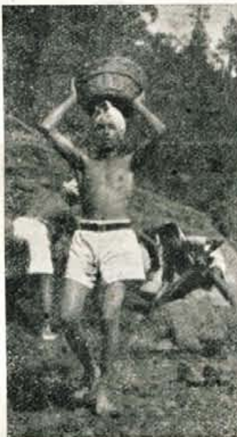
Brez tehničnih sredstev indijski delavci z golimi rokami gradijo gigante

mogočih načrtov in predlogov, kako se rešiti te krize. Bilo je, kakor pravi neka indijska