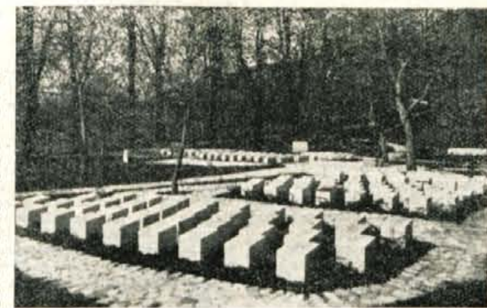
Grobišče talcev v Begunjah

S takim delovanjem ruši KZ Kranj socialistične odnose med zadrugami. Na to jo je opozorila že Okrajna zadruga zveza, toda KZ Kranj še naprej deluje po starem načinu. Taka trgovina jemlje zadrugištvu na velikem področju njegovo materialno osnovo. Zadrugne so poleg občin edine ustanove, ki lahko skrbje za