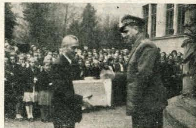
V nedeljo so odprli novo poslopje gimnazije v Skofji Loki (Glej poročilo na 3. strani.)

na analiza teh rezultatov, ki jo bodo pripravili v prihodnjih dneh občinski odbori SZDL in s katero bodo lahko konkretno stopili v borbo za popularizacijo naših dosedanjih uspehov in pa v borbo za udeležbo na volitvah. Dolžnost sprejetih kandidatov pa bo, da se sami seznanijo s problemi svojih enot in da jih tako bolje spoznajo tudi volivci.