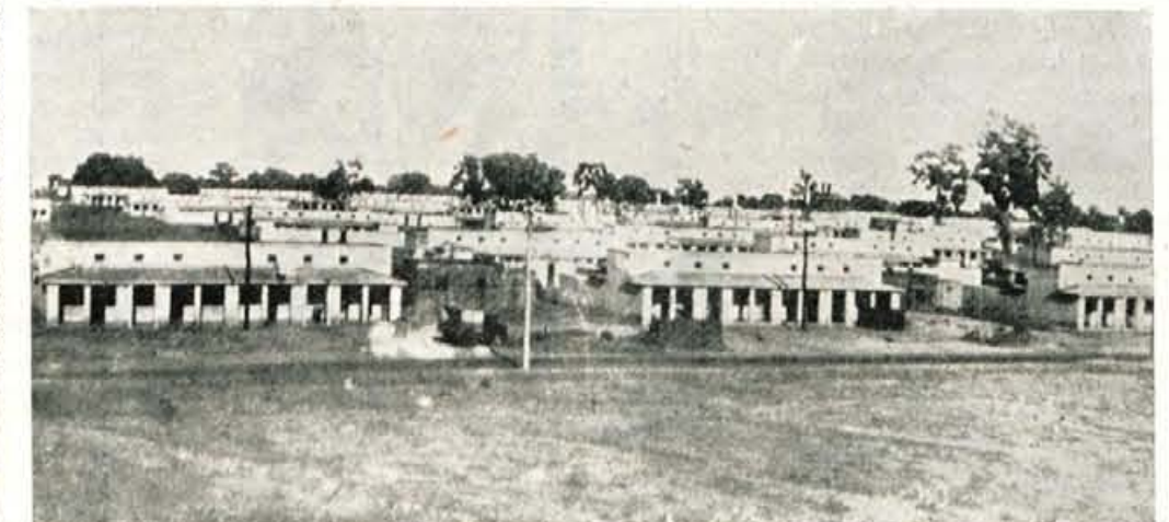
Delavsko naselje v novem mestu Sindri s tovarno umetnih gnojil, ki je bilo zgrajeno v sedanji indijski petletki