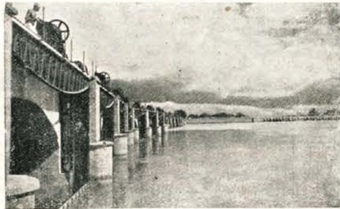
Dolinska zapora Anikut, najstarejši jez v Indiji

Takoj po osvoboditvi se je v deželi pojavilo mnogo vseh