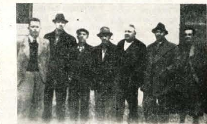
Rešeni so se drugi dan fotografirali pred istim zidom

Nekateri, ki so iskali rešitve sami in se odtrgali od glavnine, so prišli brez izjeme v roke sovražniku. Nemci so jih takoj odpeljali ter jih razkazovali v Žireh, da bi s tem pokazali svojo moč in brezuspešnost naše borbe. Na terenu so