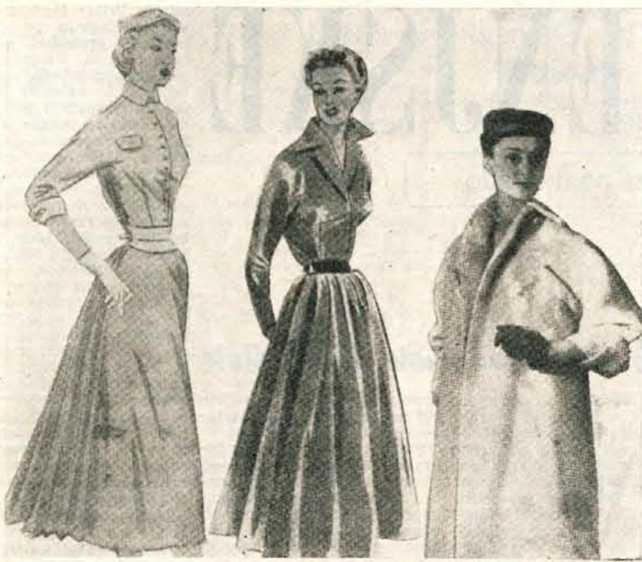
1. Svetlosiva obleka iz lahkega volnenega blaga. Rumen pas in manšete jo napravijo zelo učinkovito. 2. Prijeten, enostaven model iz pepita tkanine. 3. Eleganten jesenski plašč svetle barve.