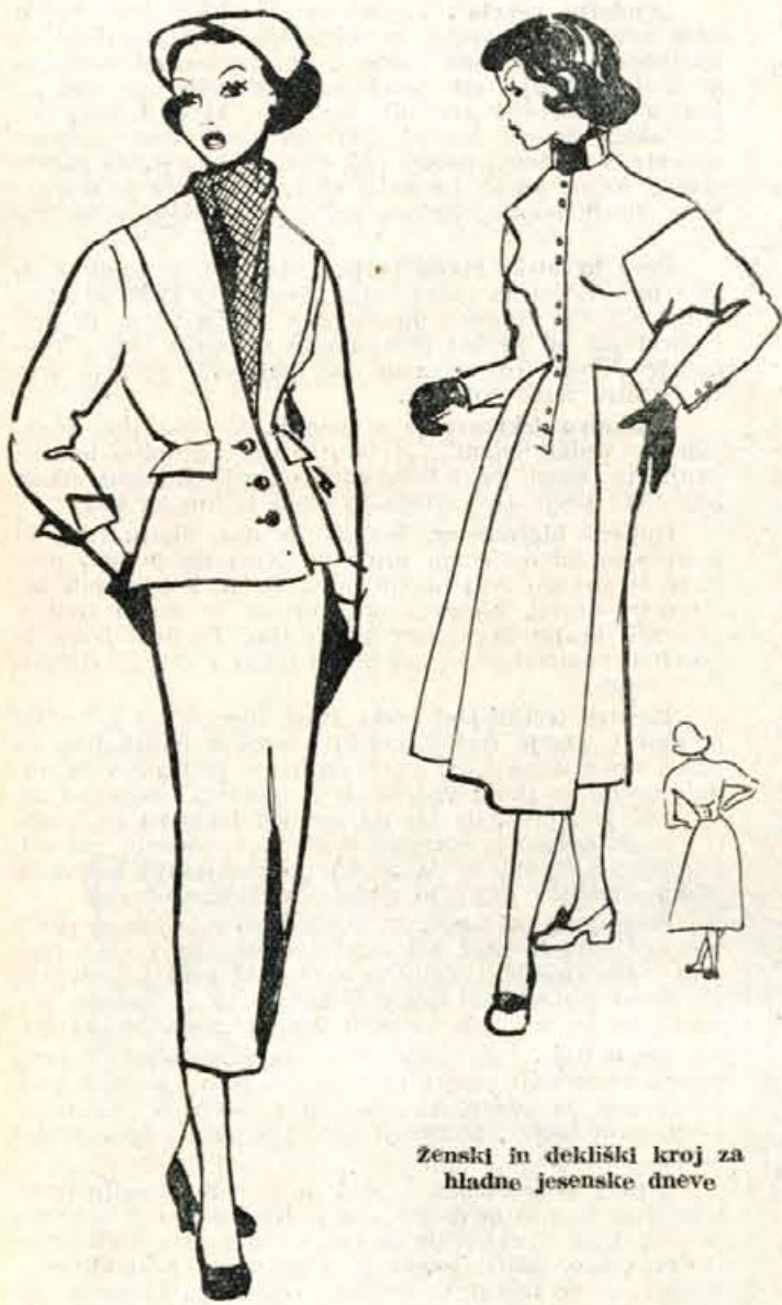
Ženski in dekliški kroj za hladne jesenske dneve

Jabolka in hruške, kakor jih že dolgo poznamo in uživamo, ni bilo vedno v naših krajih. Marsikatera vrsta našega sadja ima prav čudno zgodovino. Predzgodovinski človek sploh ni poznal sadnega drevesa. Človek je bil najprej lovec, potem nomad, nato poljedelec in šele za tem je začel gojiti sadna drevesa. Zibelka in domovina sadjarstva je orient s svojim toplim podnebjem. Iz orienta so prenesli razne sadne vrste v Evropo. Stari Grki so gojili jabolka, hruške, kutne, češnje in češplje. Marelico in breskvo so šele kasneje prinesli iz orienta. Grški zdravnik Hipokrates, ki je živel obrog 1400 pred n. št., je izumil umetnost cepjenja.