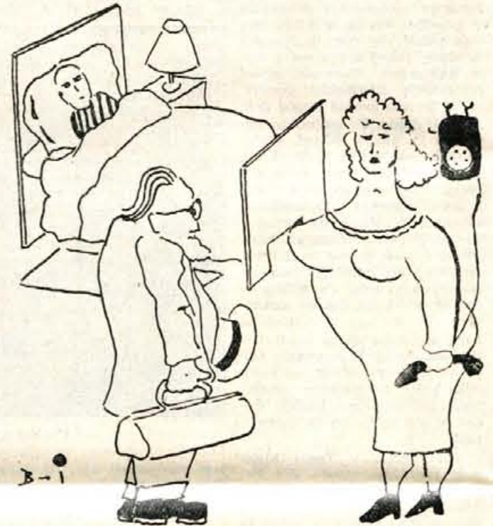
Ona zdravniku: Povejte, prosim, ali bo ozdravel. Imam namreč štiri rožnate obleke v delu in šivilja me pravkar sprašuje, ali naj jih sešije.