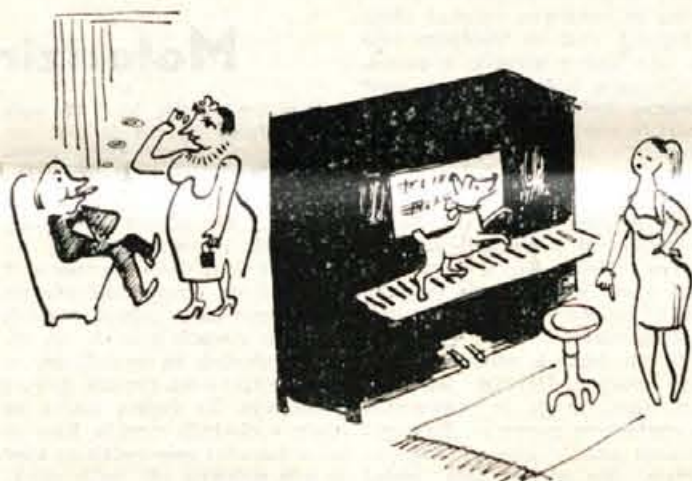
Ponesrečen poklon Obiskovalec gospođni: »Vaša hčerka je izreden klavirski talent.«

Nekatere ženske z občutljivo kožo lahko rjavo polt drago plačajo. Sonce jim kožo tako izsuši, da postane zgubana in veta, mnogim se začnejo celo lasje lomiti. Zato je tembolj potrebno, da si take ženske pridno mažejo obraz z mastno kremo in s lasje ob daljšem sončenju pokrijejo.