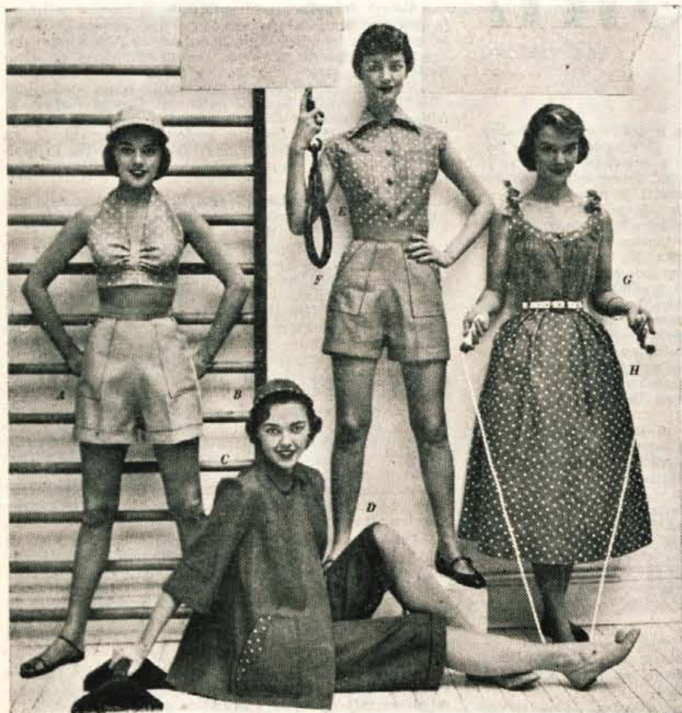
Kopalna sezona je v polnem teku. Stirje prijetni vzorci za vroče popoldneve.

Motne šipe očistimo z zelo razredčeno solno kislino. Pazimo na roke!