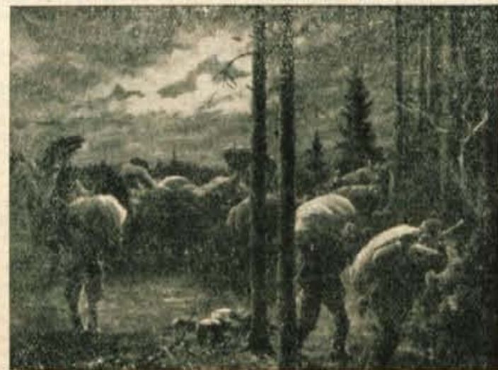
Iz vseh okoliških vasi so prinašali partizanom hrano...

ogromne izgube, hkrati pa njegove vojske zelo demoraliziralo. Partizani so bili še vedno na višku moči in bi lahko vzdržali še več dni. Primanjkovatpa jim je začelo municije, zato so se morali kljub zmagi umakniti. Ko se je že močno stemnilo, so se