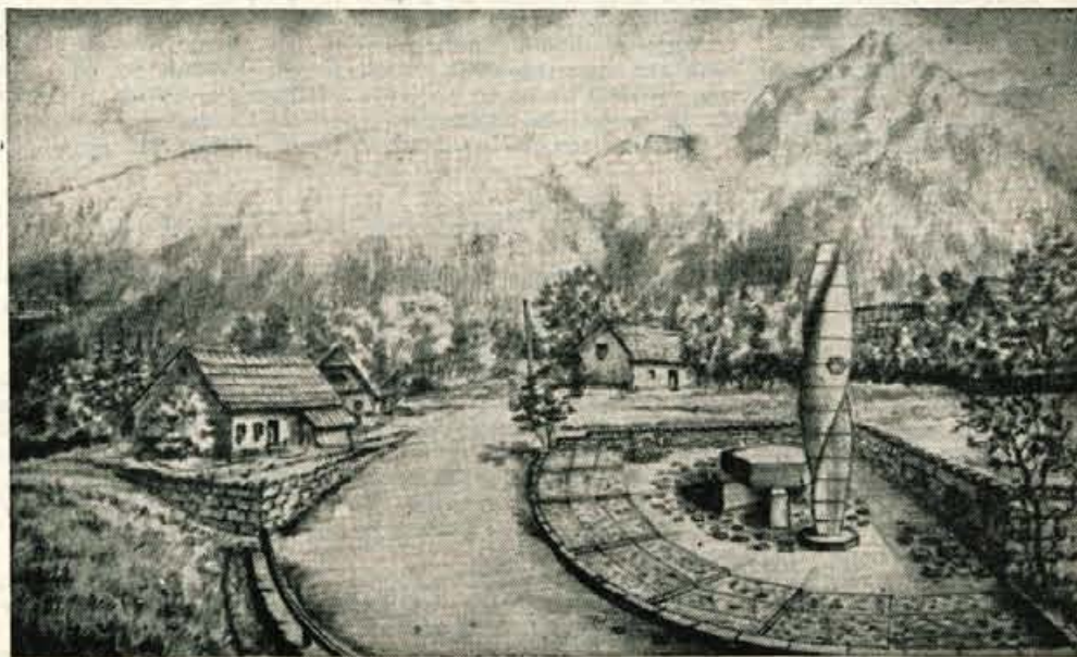
V nedeljo, 14. junija na svilenje v Goričanah na partizanskem slavlju! Na sliki: spomenik padlim borcem, ki ga bodo Goričani ta dan odkrili.