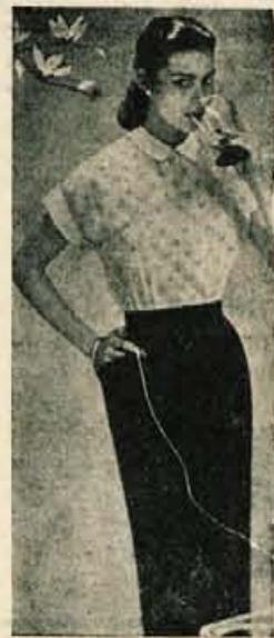
Zgoraj: Popoldanska ali koncertna obleka

Vsekakor pa je dobro, da gre žena med nosečnostjo vsaj nekajkrat k zdravniku za porodništvo ali k splošnemu zdravniku, da ji pregleda urin in ugotovi proti koncu nosečnosti otrokovo lego.