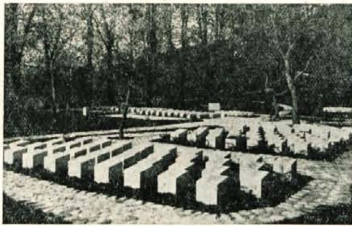
Grobišče talcev izza bivše kaznilnice

čajen občinski praznik. Proslava se je udeležilo nad dva tisoč ljudi iz vse Gorenjske, sodelovale so organizacije z Jesenic, Podbrezj in bližnje okolice. Prisostvovali so predstavniki obeh gorenjskih okrajev.