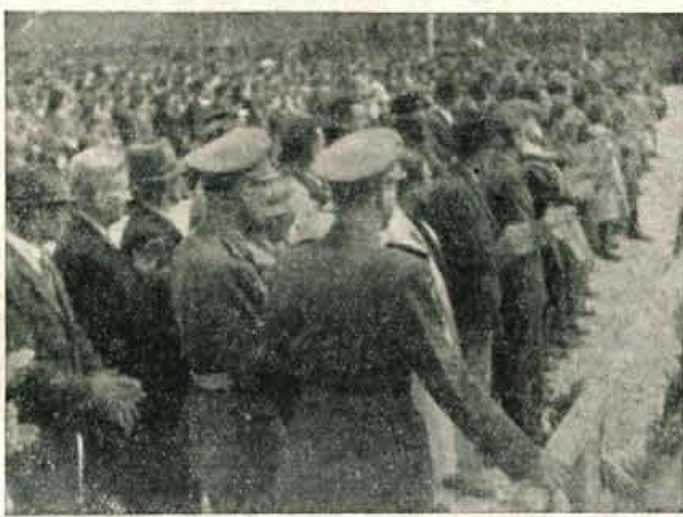
Koroški borci, postrojeni pred tribuno

ljona. Sprehajal se je med njimi. Govoril je o velikih borbah in uspehih koroških partizanov, ki so že v letu 1942. prisilili takratne nacistične oblastnike, da so priznali, »da se je narodnoosvobodilno gibanje v tem času močno razvilo tudi okrog železne Kaplje, Borovelj in v Podjuni.« Dotaknil se je tudi vprašanja narodnostnih