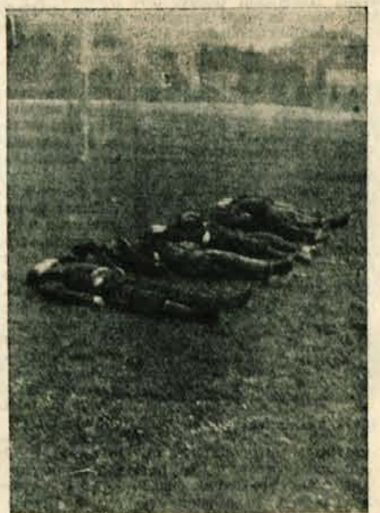
Padli v Udrem borštu

kaj ur je četa zapustila vas. Takoj po tem se je zaslila silovito streljanje pred vasjo, kar je pomenilo, da v vas »prodirajo« Nemci iz bližnjih postojank. Rafali iz partizanskih strojin so jim najbrže povzročili dokaj