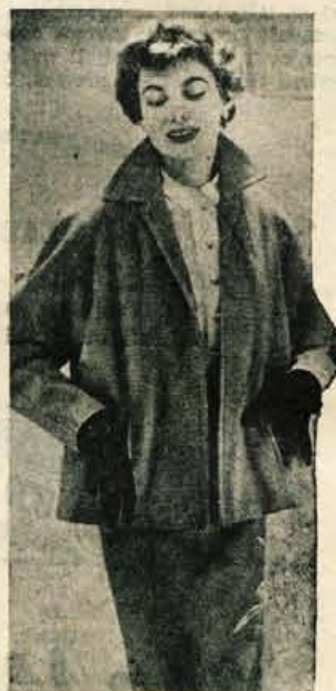
Desno: Eleganten spomladanski kostim