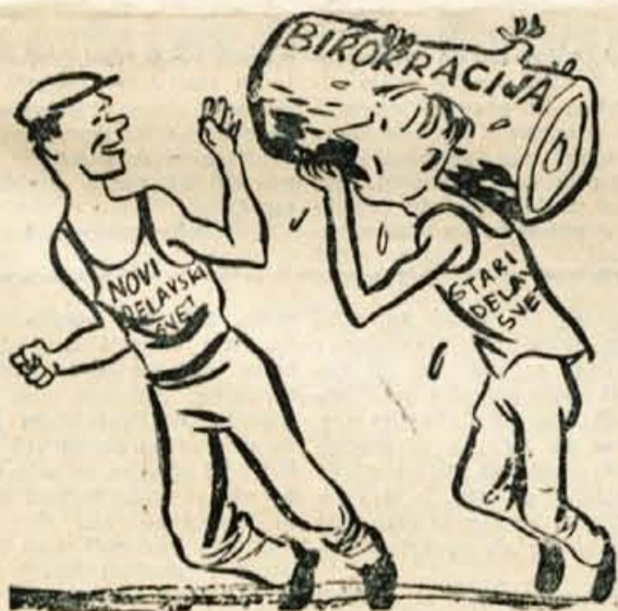
»Hvala! Bom kar brez štafetne palice.« (Iz »Totega lista«)

V soboto, 28. marca ob 17. uri bo v stranski dvorani Sindikalnega doma v Kranju javno