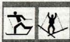
A 6, 7, 8

Opozorilni znaki (C-1, C-2, C-3, C-4 in C-5) so okrogle oblike premera 40 cm. Na rumeni podlagi je v črnem trikotniku simbol, ki napoveduje ovire ali spremembe na progah ali aktivnosti upravljalca pri vzdrževanju proge.