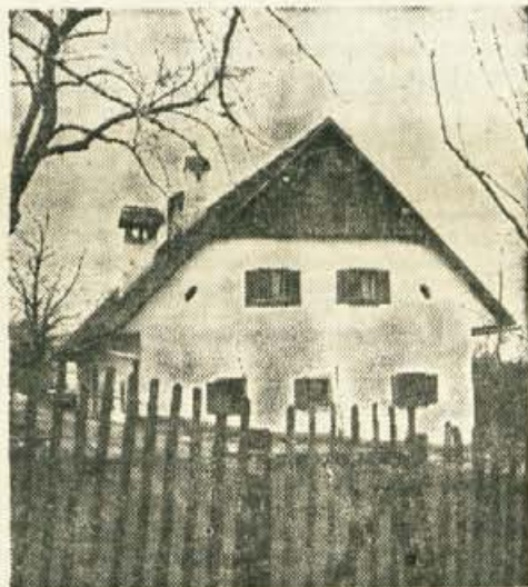
Vrba, Prešernova hiša

(1) prim.: Kidrič F. — Finžgar F. S., Vrba, Prešerni, Prešeren, Ribičev dom, Izd. in zal. Odbor za odkup Prešernove rojstne hiše, Vrba 1939, stran 5;