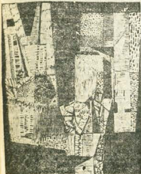
Štefan Simonič: Krošnja I — lesorez 1963