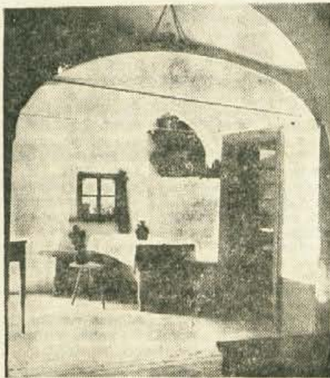
Vrba, Prešernova hiša — veža s »klasicističnimi« oboki