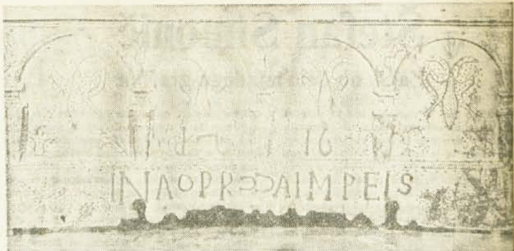
Renesančna fasadna skrinja z letnico 1716 z Rodin pri Zirovnici. Najstarejša ohranjena gorenjska kmečka skrinja z upodobitvami figurativnih motivov dvoglavega orla in cvetov (tulipan). Gorenjski muzej Kranj

Tipski razvoj skrinje je pogojen v splošni kulturni stopnji in tehničnih dosežkih posameznih dob in končno tudi v estetskih pojmovanjih posameznih dob in pokrajin. Na začetku razvoja je skrinja izdelana iz debla, kakršne so še ohranjene v Skandinaviji, v Avstriji in Črni gori in imajo svoje oblikovne predhodnike v prazgodovinskih krstah — deblakih in predzgodovinskih koritastih posodah iz lesa ali kamna. Pri nas moremo sklenjeno slediti temu razvoju šele od njene mlajše oblike, tako imenovane strešne skrinje, napravljene iz tesanih desk, vstavljenih v izžlebljene opornike. Oblike strešnih skrinj, ki so brez dvoma vplivane v oblikah hiš, so znane že iz antike, vendar postavljajo raziskovalci na osnovi arheoloških odkritij njih nastanek v zgodnejše dobe, saj so dokazala prisotnost take lesne konstrukcije (vlaganje desk v izžlebljene opornike — stebre) v Srednji Evropi že od kasne latenske dobe. Vlasta Domačinović, ki je preučevala skrinje iz tesanih desk na območju Jugoslavije, zaključuje na osnovi lingvističnih primerjav slovanskih izrazov za orodje za obdelovanje lesa, da je morala biti že v slovanski pradomovini tehnika obdelovanja lesa na primerni višini pa tudi na osnovi določene konstrukcijske posebnosti tesane skrinje, ki je skup-