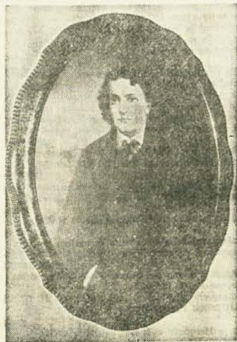
Doslej še neznan Prešernova podoba, delo Ivana Vavpotiča

12. raziskuje stilistične in jezikovne značilno-