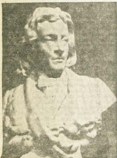
Alojzij Gangl: France Prešeren v belem marmorju

Današnja Snovanja so posvečena spominu največjega slovenskega pesnika dr. Franceta Prešerna ob obletnici njegove smrti