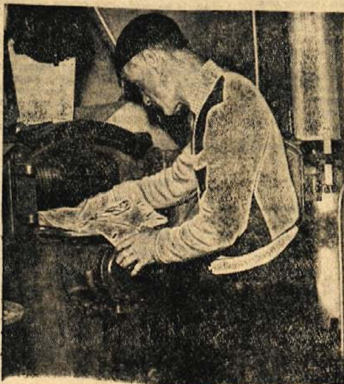
Kemična čistilnica, ki jo ima servis stanovanjske skupnosti Siražišče v Kranju, je tamkajšnjim prebivavcem nadvse dobrodošla

Naj omenimo le en negativen pojav. Na Jesenicah je obrtna delavnica za popravilo radijskih in televizijskih aparatov, ki zaposluje dva širokovna delavca in je kljub večletnemu obstoju še vedno pomanjkljivo opremljena. Poleg te delavnice je stanovanjska skupnost Javornik-Koroška Bela ustanovila servis za popravilo radioaparatorov in isto je nameravala storiti krajevna skupnost Plavž. Te delavnice so zelo slabo opremljene, zato tudi njihove usluge niso kvalitetne. Za takšnimi servisi se skrivajo šušmarji, ki jim je potrebna samo firma krajevske skupnosti,