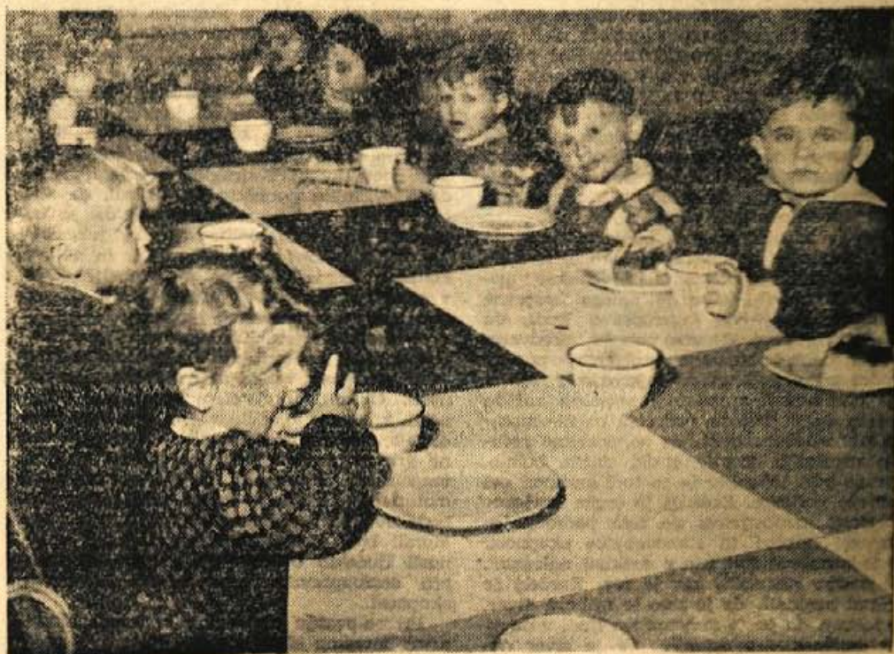
Videti je, da se malčki v vrtcu dobro počutijo