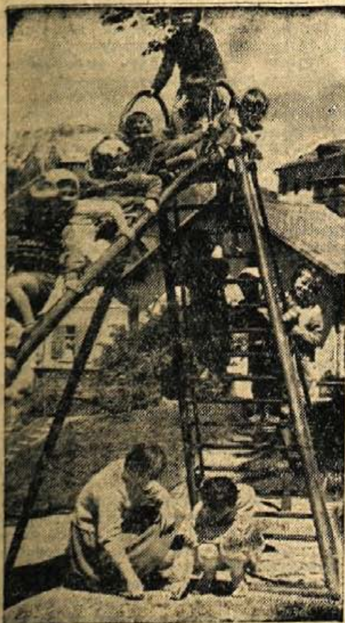
Otrokom primerna igrišča

upoštevati ljudski ekonomski čut, ki bi ga odgovornim činiteljem posredovale krajevne skupnosti. Na vsak način bi morali doseči, da bi krajevne skupnosti sodelovale pri odločitvah o vseh novogradnjah in s tem seznanjale širši krog državljanov. Če prislusnemo kritiki na račun neekonomskih in neestetskih gradenj, lahko ugotovimo, da je ta kritika večinoma upravičena. Kritika pa je umestna in učinkovita le pred začetkom gradnje, zato je potrebno omogočiti občanom, da preko krajevnih skupnosti izrazijo ob posameznih gradnjah svoje mnenje.