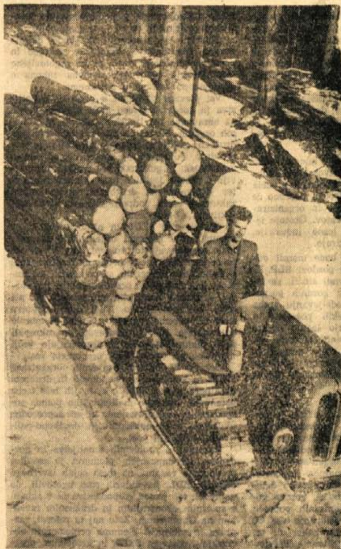
Največ hlodovine drugega lesa više v dolin goseničar