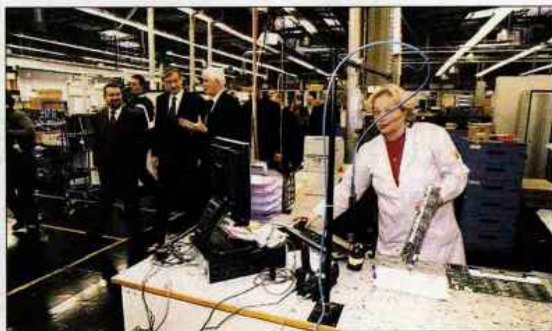
V podjetju Iskratel so mu predstavili svoje razvojne projekte.

Ob svojem obisku v Kranju se seveda ni mogel izogniti