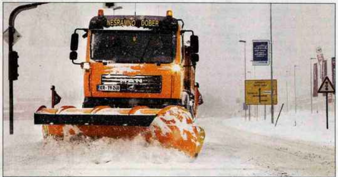
▶ 3. stran Zima je v sredo odločno pokazala zobe voznikom in cestarjem.

več avtomobilov zdrsnilo s cest, prometna nesreča pri avtocestnem uvozu pri Vodica pa je povzročila dolge zastoje. Tako je pot od Kranja do Ljubljane trajala tudi poltretjo uro. Cestarji sredin prometni kaos, ki je bil najhujši na območju Kranja, pripisujejo predvsem nizkim temperaturam, saj sol ni raztapljala suhega snega, na vozliščih pa se je ustvarila snežna deska. Po zagotovilih vodje zimske službe cestnega podjetja Kranj Damjana Pestotnika, so se plugi in posipalniki na ceste odpravili pravočasno.