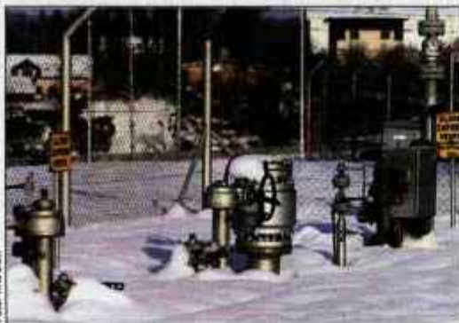
Redukcije zemeljskega plina v Sloveniji še niso bile potrebne.

in dobave zemeljskega plina iz drugih virov, tako da redukcije v državi niso bile potrebne. To so nam včeraj potrdili tudi v kranjskem Domplanu, ki svojim tri tisoč odjemalcem v zimskem obdobju dobavljajo med 2,7 in 3 milijoni kubičnih metrov plina na mesec. "Geoplin nam za zdaj nemoteno dobavlja plin, prav tako Domplan nemoteno preskrbuje svoje odjemalce. Res pa je, da na zahtevo Geoplina v toplarni Planina manjši kotel obratuje na mazut. Tako pridobimo okoli 40 odstotkov toplotne energije," je pojasnil Vlado Ahčin, vodja dejavnosti toplotne oskrbe.