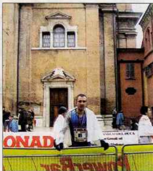
Če je prvi maraton rekreativnega tekača opravljen pod tremi urami, je že to samo po sebi velika zmaga.