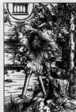
Albrecht Dürer, Prizor iz Janezovega Razodetja, 1498