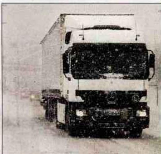
Nekateri vozniki težjih tovornjakov tudi tokrat niso upoštevali opozorila, da se morajo ob začetku sneženja izločiti iz prometa.

Cestno podjetje Kranj s svojimi 45 vozili za pluzenje in posipanje ter s pomočjo kooperantov vzdržuje 524 kilometrov državnih in 220 kilometrov lokalnih cest. Sneženje v zgodnjih urah sredinega jutra je bilo očitno prehud zalogaj, čeprav snežne padavine niso bile obilne. Po oceni Damjana Pestotnika iz Cestnega podjetja Kranj je nevarnosti v prometu povzročilo predvsem nedelovanje soli, ki bi pri temperaturi minus dve stopinji Celzija precej lažje topila sneg, pri minus štiri ali pet stopinj Celzija pa se je njena učinkovitost bistveno zmanjšala. Pestotnik tudi meni, da so se cestarji s plugi in posipalniki pravočasno odpravili na delo in zavrača očitke, da so težave nastale zaradi prepoznega pluzenja. Oteževalna okoliščina za cestarje je dejstvo, da je bilo sneženje od četrte ure dalje najbolj intenzivno na območju Kranja in Škofje