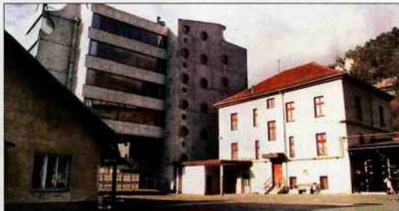
Občina Tržič prodaja tudi prostore obrata PGP (na sliki levo) pod nekdanjo upravno stavbo podjetja Peko.

Vodstvo tržiške občine se je že lani odločilo, da bo prodalo nekatere opuščene objekte podjetja Peko, ki jih je država v preteklosti prenesla v njeno last. Na decembrski seji je občinskemu svetu predlagala prodajo dveh stavb. Prva je poslovna stavba nekdanje družbe PGP v tovarniškem kompleksu Peko. Gre za dobrih 908 kvadratnih metrov prostorov v kleti, pritličju in mansardi. K temu spada še 964 kvadratnih metrov zemljišč. Iz-