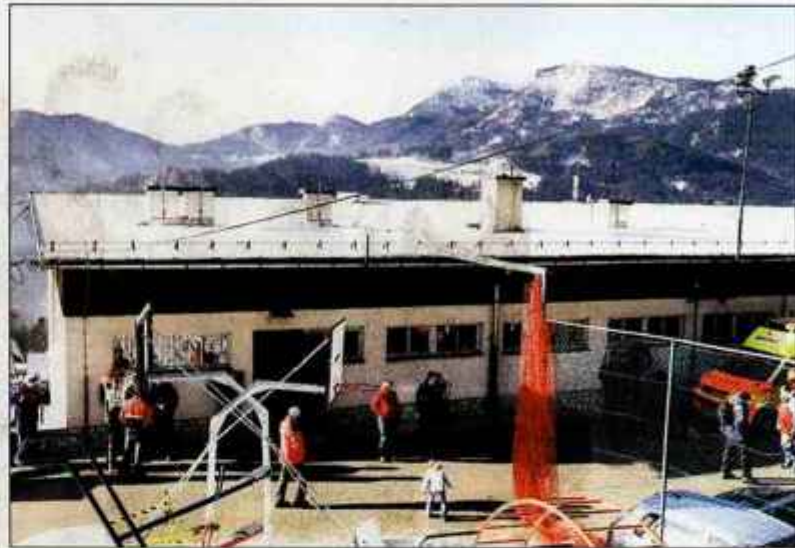
Podružnična šola v Dražgošah, ki jo v tem šolskem letu obiskuje 17 učencev, potrebuje novo streho.

A težave s šolo v Dražgošah niso edine. Po besedah ravnatelja le ena od šestih stavb, ki jih upravlja Osnovna šola Železniki, ne potrebuje večjih vlaganj v vzdrževanje. "Na drugih stavbah se pogosto pojavljajo okvare, ki zahtevajo večja vlaganja. Tako smo denimo predlani morali začeti menjati okna v matični šoli, ker so se dobesedno sama začela podirati. Težave z zamakanjem