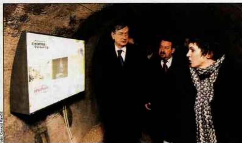
Med obiskom v Kranju si je predsednik države Danilo Türk ogledal tudi kranjske rove.

nji list, da naj bi slovenski predsednik prosil hrvaškega kolega, naj podpre njegov načrt, da bo postal generalni sekretar Združenih narodov. "Fantazija deluje po svoje," je bil kratak.