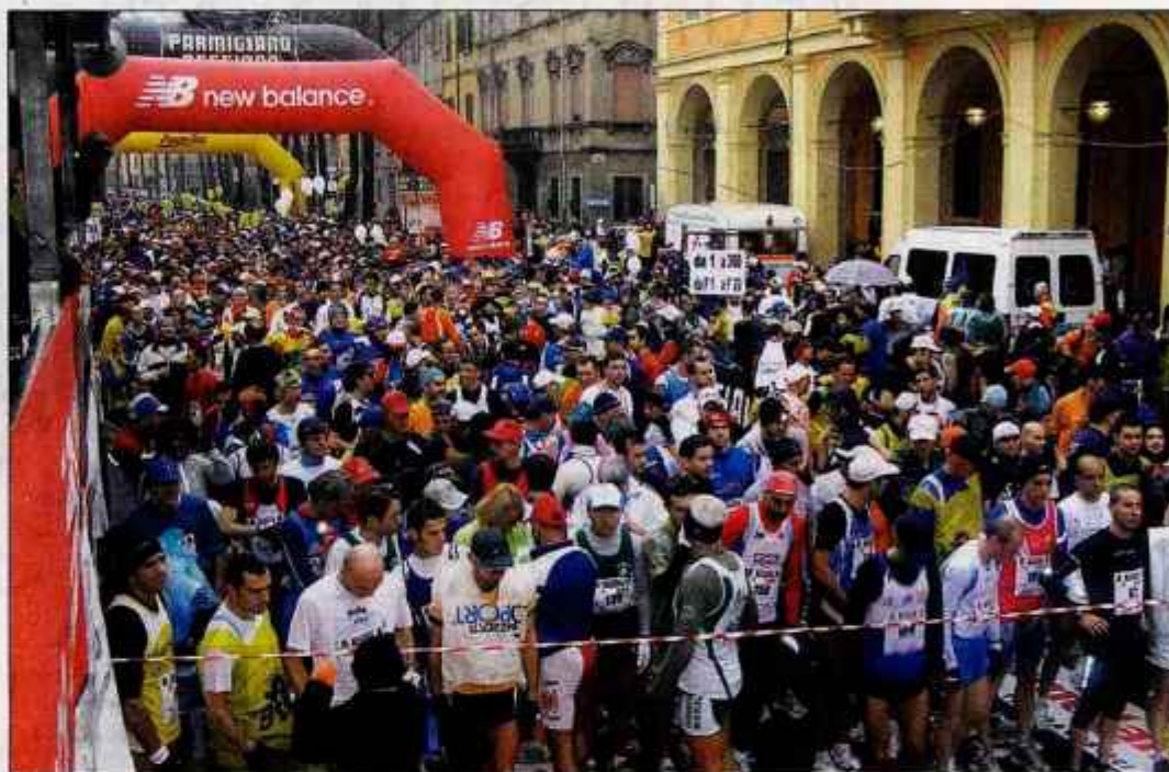
Na maratonske teke se zgrinjajo čedalje večje množice tekačev, ki tam iščejo samopotrditev in dokaz, da zmorejo nekaj velikega.

Kdor si želi stopiti na maratonsko pot, se mora že v samem začetku zavedati, da ne bo vedno lahko. To je šport garačev in tistih, ki radi trpijo in v tem uživajo.