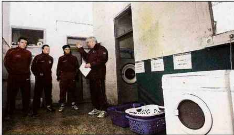
Kopalnica brez ogrevanja pri ničli ali še kakšni stopinji pod njo, slačilnice brez grelnih teles, le z improviziranim ogrevanjem, hodniki in vsi drugi prostori kot ledenice... takšna je podoba prostorov v športnem centru Kranj.