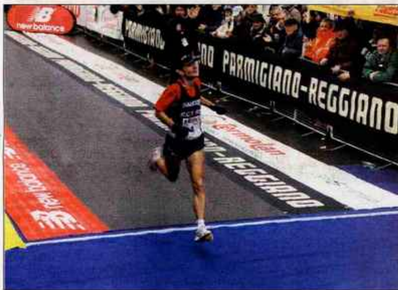
Ko tekač prečka ciljno črto maratona, ga oblije neki težko predstavljivi občutek sreče in zmage.

Tekači na dolge proge so že po naravi ljudje z dolgoročnimi cilji in vizijami, ki potrpežljivo napredujejo korak za korakom.