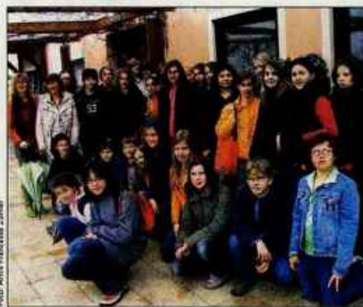
Udeleženci letošnjega literarnega tabora v St. Janžu