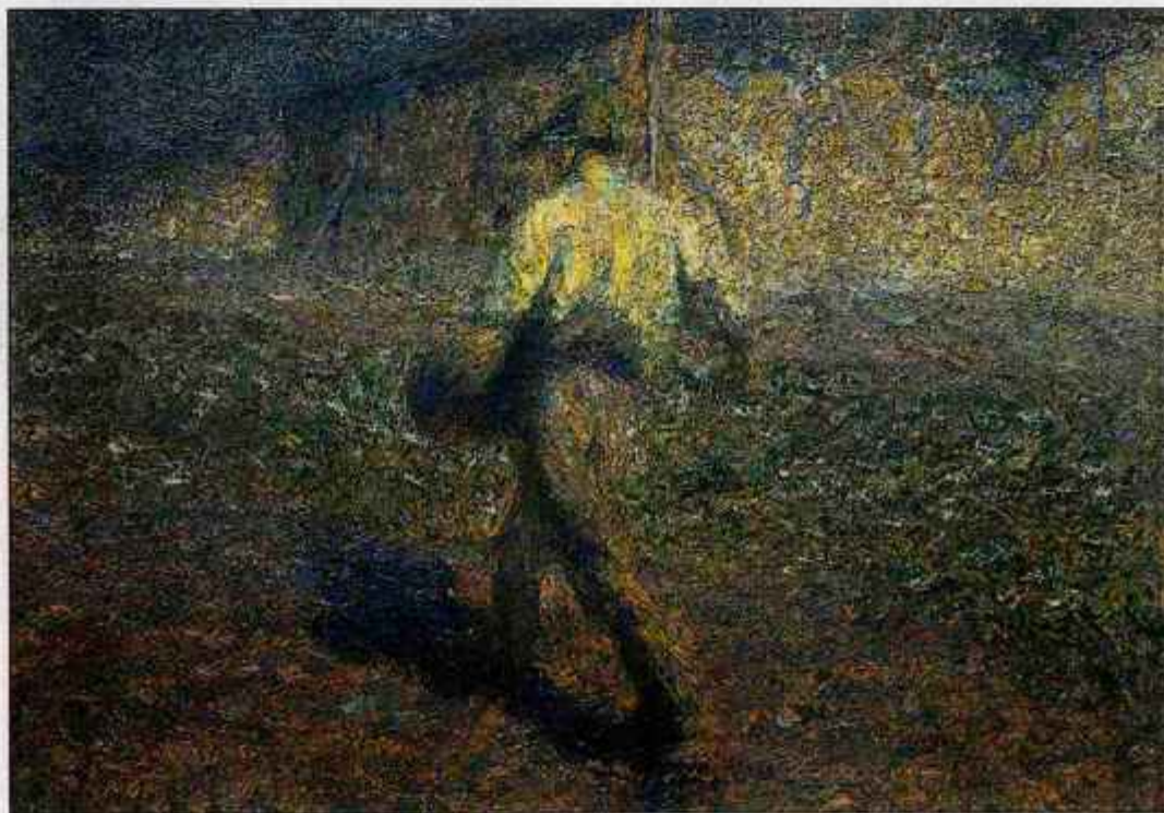
Ivan Grohar, Sejalec, 1907, na razstavi v Narodni galeriji v Ljubljani

Danes nas Groharjev Sejalec opominja, da je z našim odnosom do narave nekaj hudo narobe in ga moramo spremeniti. Sicer bo vse narobe.