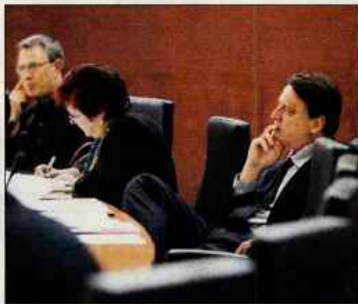
Branko Grims je v zvezi z združevanjem funkcij v prejšnjih mandatih omenjal Toneta Ropa (na sliki desno).

Ljubljana - Povod za izredno sejo, ki so jo zahtevali poslanci SDS, je bilo razkritje lastništva firme Kolonel, pomembne pri lastništvu Pivovarne Laško, ta pa ima v lasti tudi časopisni hiši Delo in Večer. O tem je na seji uvodoma obsežno govoril Branko Grims, ki je krivdo za koncentracijo kapitala pripisal dogajanju v tranziciji: posegom v zakonodajo, političnemu kadrovanju, rušenju nadzornih ustanov, združevanju funkcij. V zvezi s tem je omenil vlogo Antona Ropa, ki je v prejšnjih mandatih združeval več funkcij. Predlagatelj izredne seje, ki so parlamentu predlagali sprejetje več sklepov, povezanih s sumljivim prelivanjem premoženja v roke peščice posameznikov in njihovo obvladovanje medijev, so odgovornost za slednjo pripisovali prejšnjim vladam, ki jih je vodila sedanja opozicija. Ta pa očita vladi, da ima v rokah vse ključne institucije, vendar ni v boju proti korupciji