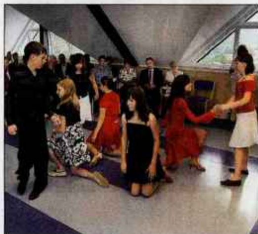
S slovesnosti ob obnovi Centra slepih, slabovidnih in starejših v novi Burnikovi dvorani