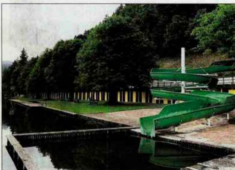
Grajsko kopališče se tudi letos lahko pohvali z modro zastavo, ki je znak za kakovostno vodo in urejeno kopališče.

"Ureditev igrišč je bila vredna 40 tisoč evrov, ki smo jih zbrali s pomočjo donatorjev." Ponudbo so popestrili še s postavitvijo projektorja in velikega platna, kjer bodo vsak dan predvajali prenos nogometnih tekem in olimpijskih iger. Obnovili pa so tudi prostor za piknik in ga malo povečali, tako da lahko pod streho sprejmejo do 60 ljudi, skupaj pa tudi do sto ljudi. Že jutri pa bodo omogočili kopanje v zunanjih otroških bazenih na letnem kopališču v Kranju. Vhod bo skozi recepcijo pokritega olimpijskega bazena. Veliki zunanji bazen bodo odprli v torek, 17. junija, v soboto, 21. junija, pa bodo pripravili dan odprtih vrat, ko bodo omogočili prost vstop na bazen. Letos v bazen znova vračajo vodna igrala, ki so bila lani poškodovana.