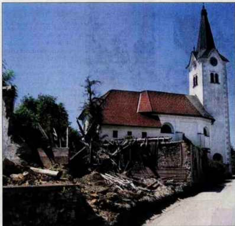
Ruševine ob vaški cerkvi skrbijo in jezijo večino Trbojcev.