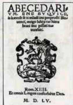
Naslovnica Trubarjevega Abecednika iz leta 1555 (v latinici)

še danes oziroma spet uporabno. Kaj pa razredni ovaduhi? "Ker učitelji ne morejo biti zmeraj z učenci ter paziti nanje in ni zato nič manj potrebno, jih tako v šoli in v cerkvi, kakor tudi sicer na ulici, privajati na red in dobro vedenje ter jih navajati na urjenje latinskega jezika, in ker imajo učenci dovolj razloga, se uredi v disputacijah, zaradi tega naj vsak učitelj določi v svojem razredu in v vsaki dekuriji /oddelku/ enega 'korničana' ali skrivnega ovaduha, ki mora marljivo nadzirati ostale součence v šoli, v cerkvi in na ulici ter zapisati, kaj je ugotovil na njih kazni-vega, in to ob določenem času pokazati učitelju, kar bo čednosti vsestransko pospeševalo, priskutnost pa preprečevalo. Kadar pa ovaduh