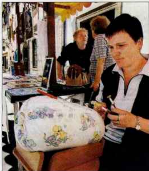
Dogodki v središču Škofje Loke so se začeli s tednom obrti in podjetništva.