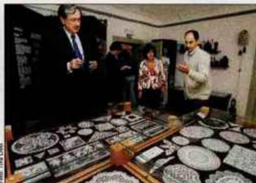
Predsednik Türk med ogledom obnovljenega muzeja

Predsednikovega obiska so se razveselili tudi v Domelu, kjer so lanske poplave povzročile za več kot osem milijonov evrov škode. Türkku so predstavili tehnologijo gorivnih celic in ga peljali skozi proizvodnjo elektromotorjev.