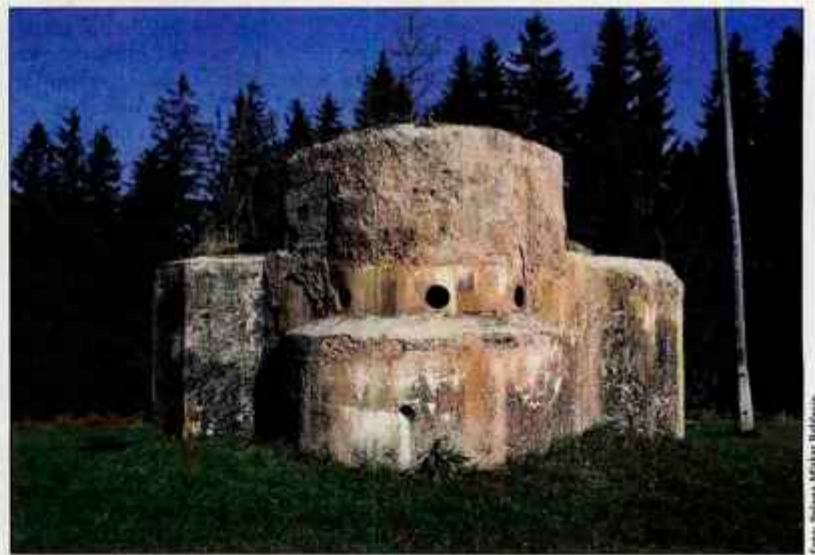
Fotogenični bunker na Javorču (Žirovski vrh) je očaral svetovno utrdboslovno elito.

Ustavili smo se najprej na Golem vrhu, kjer je največja in najbolje ohranjena utrdba Rupnikove linije; za spust v njeno imponantno podzemlje to pot ni bilo časa. Naslednji postanek je bil pri bunkerju na Javorču, od koder smo se spustili v Gorenjo vas. Tu se je avtobus komaj pretaknil skozi množico avtomobilov; vse križem so jih parkirali farani, ki so bili prav tedaj pri nedeljski maši. Utrdboljubna družčina pa je nadaljevala romanje k svojim prav nič posvečenim ciljem. Naslednji je bil na bližnjih Hlavčih Njivah, kjer stoji tretja od najbolje ohranjenih in največjih slernenskih utrdb Rupnikove linije (prvi dve sta na Žirovskem vrhu, ena na prej omenjenem Golem vrhu, druga na Hrastovski griču). Vanjo se pride po dolgem hodniku, od katerega se odcepi še več stranskih hodnikov in galerij,