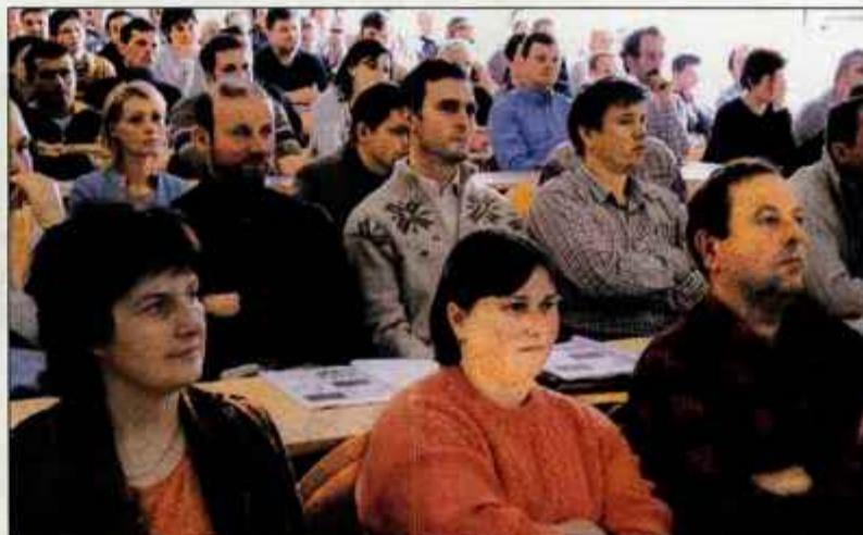
Kmetje (tudi ekološki, ki so na sliki) bodo v nedeljo volili svoje predstavnike v organe kmetijsko gozdarske zbornice.

Kranj - Vsi člani zbornice so po pošti že dobili vabila na volitve, na katerih je označeno tudi volišče, kjer bodo volili. Na Gorenjskem oz. na območju petih upravnih enot bo v nedeljo odprtih osemnajst volišč - v Lescah (KGZ Sava), na Bledu (občina), v Zgornjih Gorjah (Gorjanski dom), v Bohinjski Bistrici (Kulturni dom Joža Ažmana), na Jesenicah (stavba, kjer je Lekarna Plavž), v Kranjski Gori (občina), Žirovnici (Čopova hiša), Križah (KZ Križe), Škofji Loki (občina), Gorenji vasi (Dom občine), Železnikih (kulturni dom), Žireh (Partizan), Šenčurju (Dom krajanov), Naklem (občina), Kranju (občina), Cerkljah (občina), Predvoru (dom krajanov) in na Zgornjem Jezerskem (Korotan). Voli se osebno, nihče ne more glasovati po pooblaščenju, torej tudi ni dovoljeno glasovanje za družinske člane. Glasuje se tako, da se obkroži zaporedna številka pred imenom liste, za katero se glasuje. Že včeraj in predvčerajšnjim je potekalo predčasno glasovanje, jutri, v soboto, bo v skladu z zakonom o volilni in referendumski kampanji volilni molk, med katerim bo prepovedana volilna kampanja.